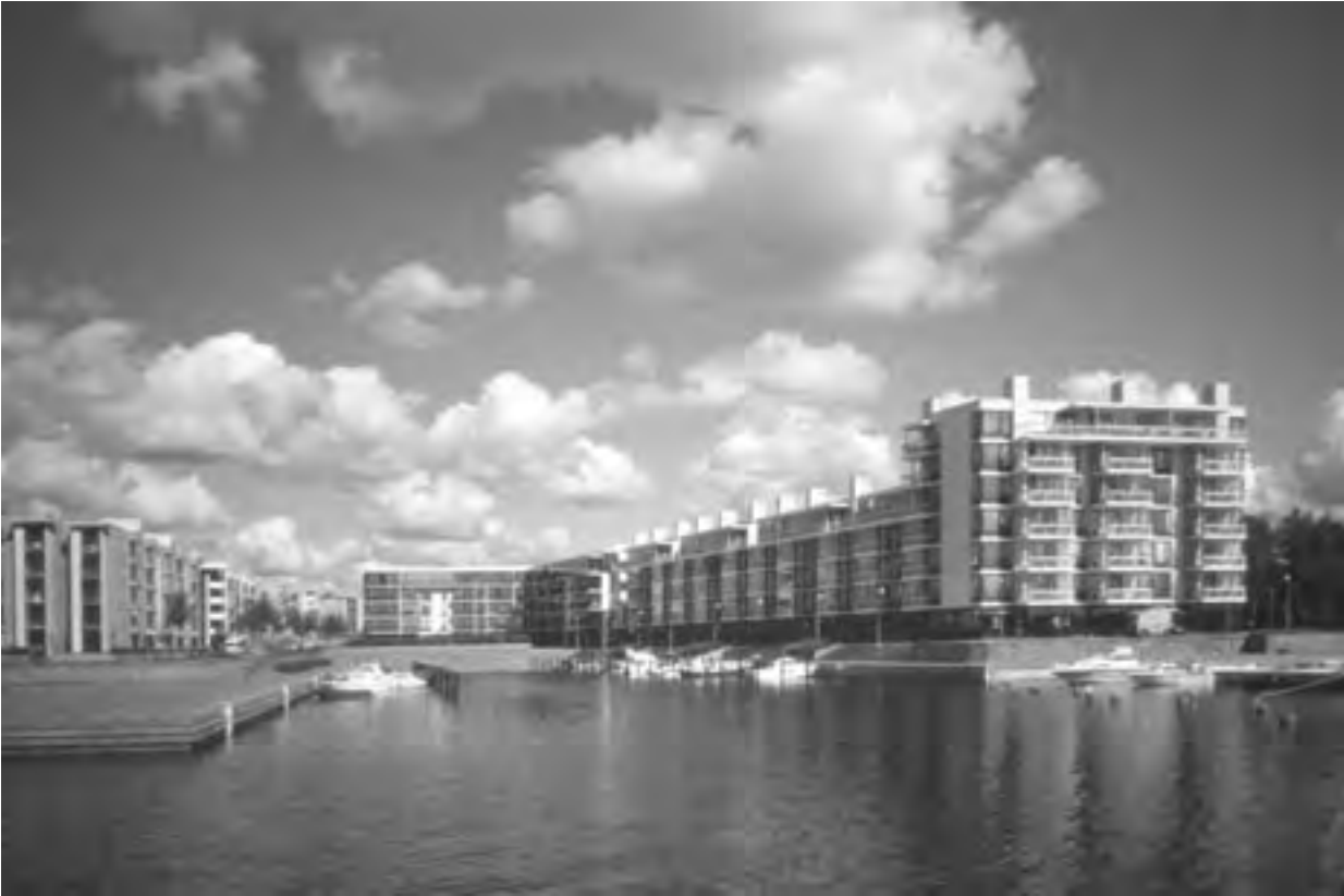
Hiekkalaiturin aukio Aurinkolahdessa, 2003.

omistamalle maalle keskimäärin 100 opiskelijasuonaa.