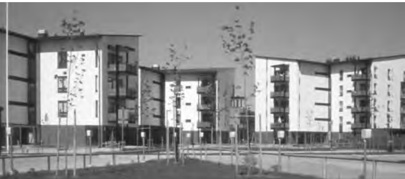
Fallkulla, 2003.

rahoitustukea hyväksi käyttäen. Lisäksi hankitaan asuntoja yhtiön järjestämällä rahoituksella markkinatilanteen sallimissa puitteissa. Hankittavat asunnot ovat etupäässä yksioita ja kaksioita sekä lapsiperheiden tilapäiseen asuttamiseen soveltuvia perheasuntoja.