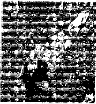
ALUEEN SIJAINNI VIIKIN ALUERAKENTAMISPROJEKTIALUEELLA