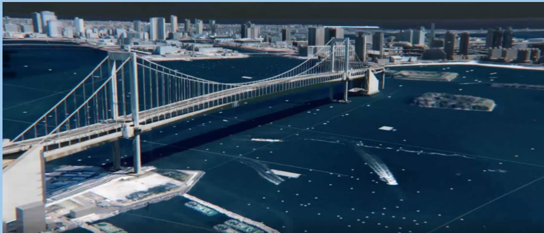
Japani: Project Plateau