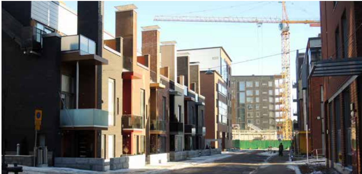
Kuva: Eija Rauniomaa, Kalasatama