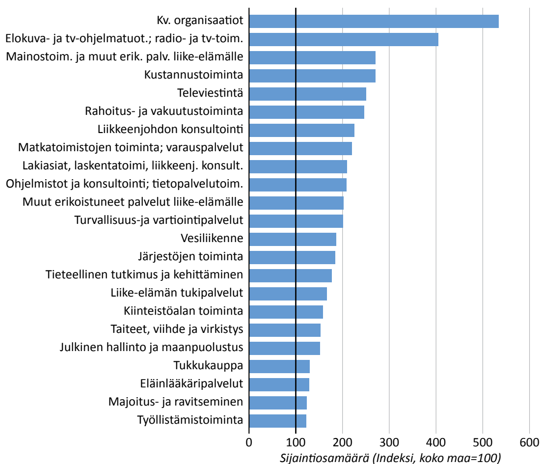
Kuvio 3. Helsingin erikoistumisalat suhteessa koko maahan 2012; sijaintiosamäärät indeksinä, koko maa=100