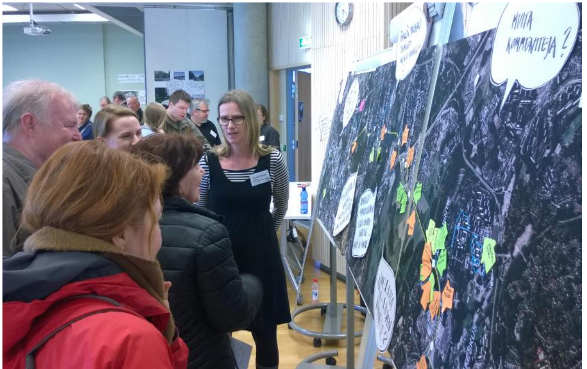
Kuva: Itä-Helsingin Jokerimessuilla keskustellaan ja kerätään näkemyksiä isolle ilmakuvalle koko Jokerireitin varrelta.

Messuvierailta pyydettiin kommentteja post-it lapuilla isolle ilmakuvalle koko Jokeri-linjasta ja sen läheisyydessä jo olevista keskeisistä toiminnoista ja myös toiveita tulevista toiminnoista. Ideat on koottu ja niitä tullaan hyödyntämään suunnittelussa ja sosiaalisten vaikutusten arvioinnissa.