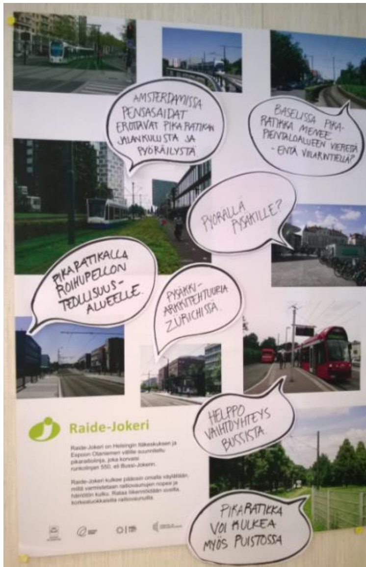
Kuva: Pikaraitiotielinja kaupungissa voi kulkea monenlaisissa ympäristöissä. Asiaa valaistiin messuilla kansainvälisin esimerkein.