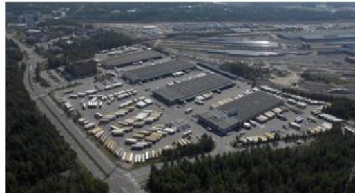
Maaliikennekeskuksen alue luoteesta.

Asuminen painottuisi alueen länsiosaan, lähelle Keskuspuistoa. Toimitilat sijoittuisivat alueen itäpäähän ja eteläreunaan, missä ne muodostavat jatkoa Käpylän asemaseudun työpaikka-alueelle. Asukkaita alueelle tulisi noin 2 500-3 000 ja työpaikkoja noin 1 000. Asuinrakentaminen olisi kerrastalovaltaista.