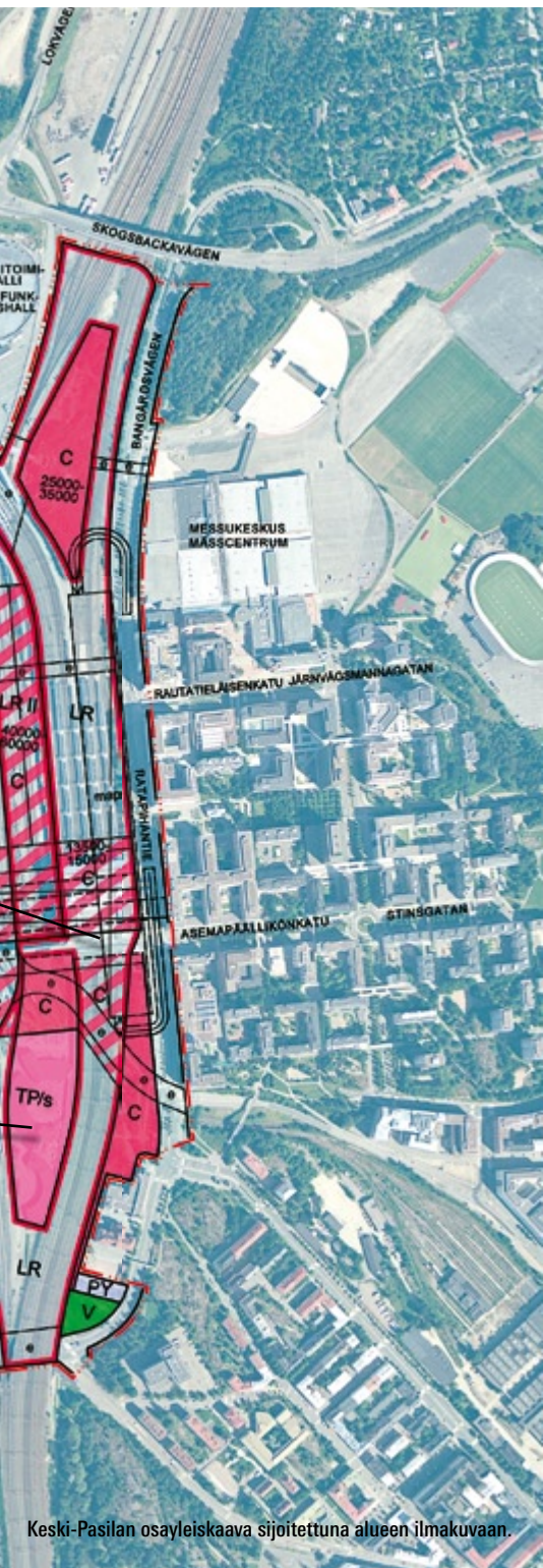
Keski-Pasilan osayleiskaava sijoitettuna alueen ilmapuun.

ja kaupungin kesken on solmittu aiesopimus Keski-Pasilan maankäytön periaate- ratkaisusta.