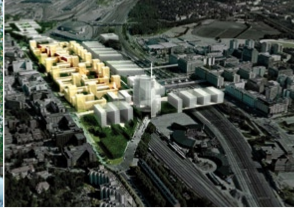
Kuva: © Arkkitehtitoimisto Tuomo Siitonen Oy