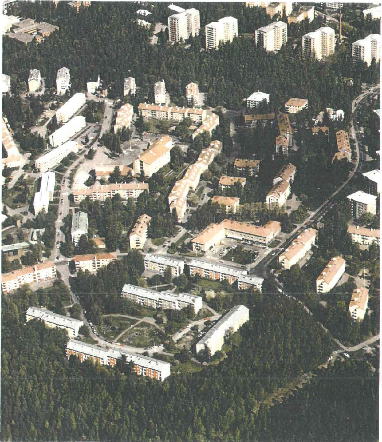
KUVA 2. Ilmakuvanäkymä Pohjois-Haagasta.

Kuvan etualalla Ida Ekmanin tien taloryhmä, joka kauniisti rajaa keskellä olevaa kalliota. Rakennusten julkisivuväriytyys on mielenkiintoinen: punertavaa ja kellertävää rapattua pintaa. Jokainen rakennus on oman värisensä. Rakennusryhmän edessä, sen eteläpuolella on säilytettävä Alppiruusu puisto, oikealla puolella ohjeellisen tontin 29116/3 rakennuspaikka.