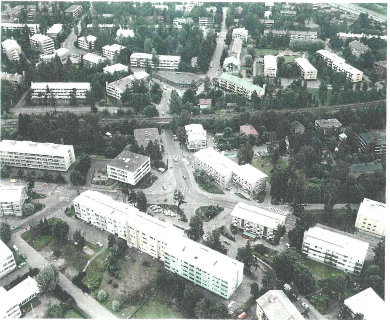
KUVA 1. Ilmakuvanäkymä Etelä-Haagan Palokaivon aukion ympäristöstä.

Alueelle ovat luonteenomaisia pienet asuinkerrostalot, jotka ovat rakennusmassaltaan yksinkertaisia ja kappalemaisia. Rakennukset seuraavat katujen ja aukoiden rajoja vapaasti mukaellen. Paikoitellen ne sijoittuvat säteittäisesti kuten Ryytimaantiellä oikealla ylhäällä. Rakennusten päädyissä on aina ikkunoita.