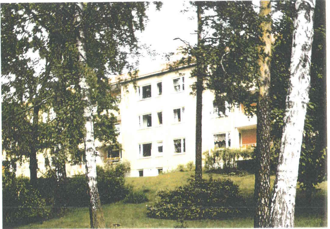
KUVA 3. Haagan idylliä suunnittelualueen lähiympäristöstä: Haagan Pappilantie 5.