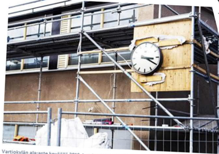
Vartiokylän ala-aste keväällä 2016, kun koulussa tehtiin tiivistyskorjauksia.

Helsinkiä koulutuksen sisäilmaongelmia on ratkottu pikkukorjauksilla, kertoo, että pieleen meni.