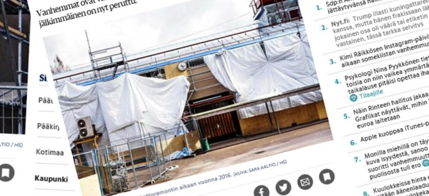
Vartiokylän ala-aste keväällä 2016, kun koulussa tehtiin tiivistyskorjauksia.

Helsinkiä koulutuksen sisäilmaongelmia on ratkottu pikkukorjauksilla, kertoo, että pieleen meni.