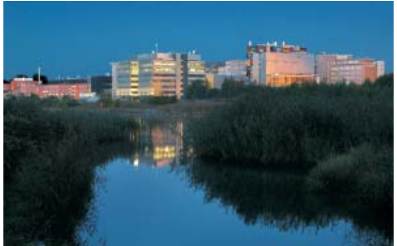
Arabianrannan yritys- ja koulutusrakennuksia. | Byggnader för företagsamhet och utbildning i Arabiastranden.

”Yritys ei ole mikään taivaasta pudonnut toimija, joka voisi vapaasti valita ympäristönsä, vaan yritys on ympäristönsä ”kätkemä”: miljöön on se, joka tekee aloitteita ja on innovatiivinen (...) Hypoteesina on siten paikallisen miljöön keskeinen rooli uusien innovaatioiden synnyttäjänä, prisma, jonka innovaatioita kohden suuntautuvat ponnistukset läpäisevät (...) Yritys ei ole eristäytynyt innovatiivinen toimija, vaan se on osa miljöötä, joka saa yritykset toimimaan. Innovaatioiden pääkomponentteja ovat alueiden historia, niiden organisoituminen, niiden kollektiivinen käyttäytyminen sekä niitä rakenteistava konsensus.” (Viittaus Bramanti ja Ratti (1997, 22), käännös tekijän).