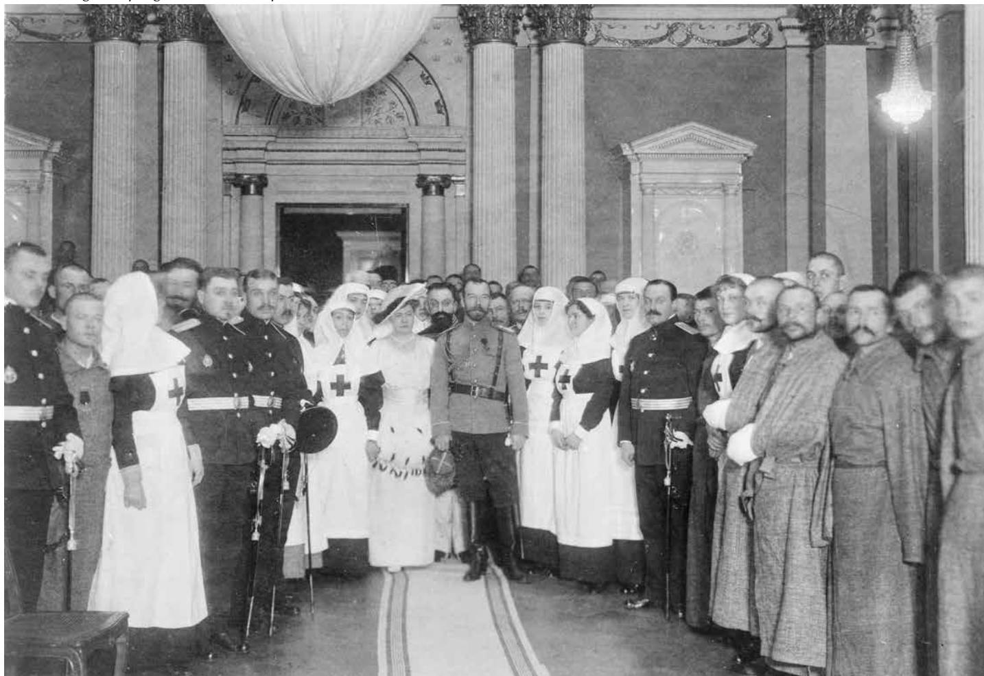
Keisari Nikolai II vieraili yhden kerran hallituskaudellaan Helsingissä. Päivän mittaisen käyntinsä aikana 10.3.1915 hän tutustui mm sotasairaalana toimineeseen Keisarilliseen palatsiin (nykyinen Presidentinlinna).