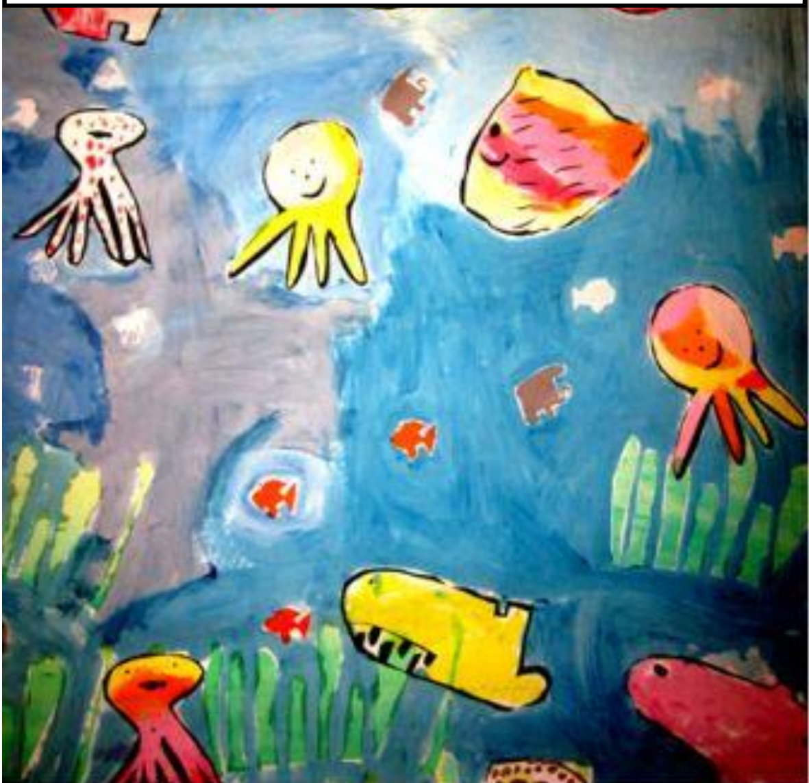
Kuva: Meritähtien maalaus vuodelta 2006