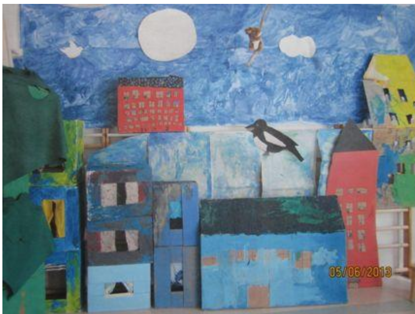
Tässä valokuvassa on lasten itse suunnittelema ja toteuttama lavastus kevätjuhlia varten keväällä 2012.

Valokuvien ja videoin esittelemme päiväkodin arkea ja tapahtumia. Ennen kuvaamista kysymme kaikilta lapsilta kuvausluvut. Valokuvia on esillä lasten ja vanhempien nähtävissä ryhmissä, ja joitain kuvia lähettemme myös sähköpostilla vanhemmille. Päiväkotitoimintaa dokumentoimalla pystymme kertomaan ja kuvaamaan vanhemmille ja muille yhteistyötahoille, millaista toimintaa päiväkodissamme on. Dokumentointi tekee näkymättömän näkyväksi. Sen avulla on mahdollista seurata, arvioida ja kehittää päiväkodin toimintaa. Jokainen ryhmä tiedottaa toiminnastaan perheille mm. kuukausitiedotteiden muodossa.