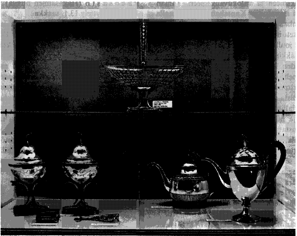
Empire-tyylistä esineistöä: Näyttelyssä Suomalaista hopeaa kautta aikojen, joka oli eräs v. 1972 järjestetyistä erikoisnäyttelyistä.