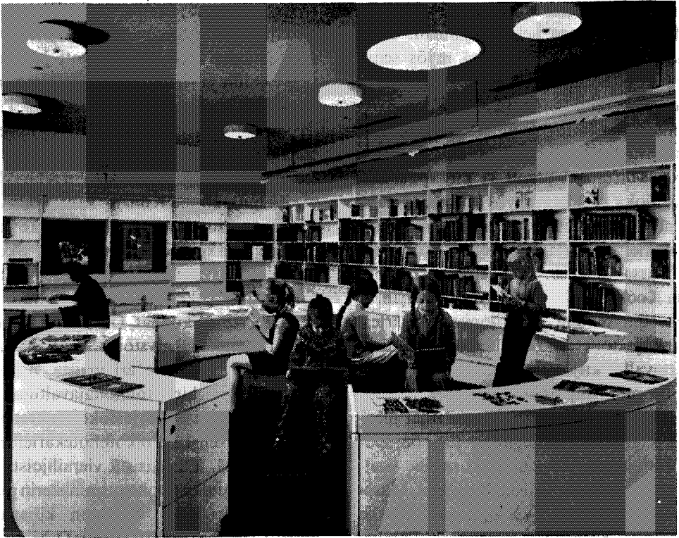
Herttoniemen lastenosastoa hallitsee pyöreä kuvakirjahylly, joka tarjoaa houkuttelevia mahdollisuuksia mukavien lukuasentojen kokeilemiselle.

ja kuunneltuja levyjä 32 637 (29 633). Yhteensä 61 953 (54 120) henkilöä kuunteli 40 767 (37 975) levyä.