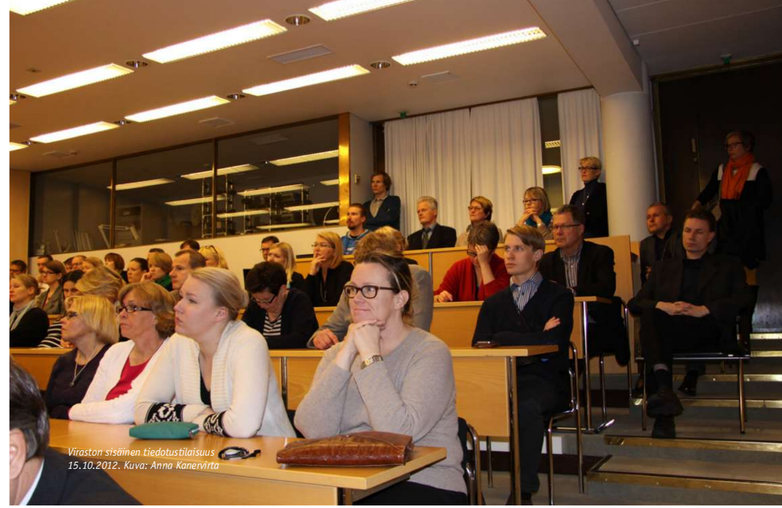
Viraston sisäinen tiedotustilaisuus 15.10.2012.