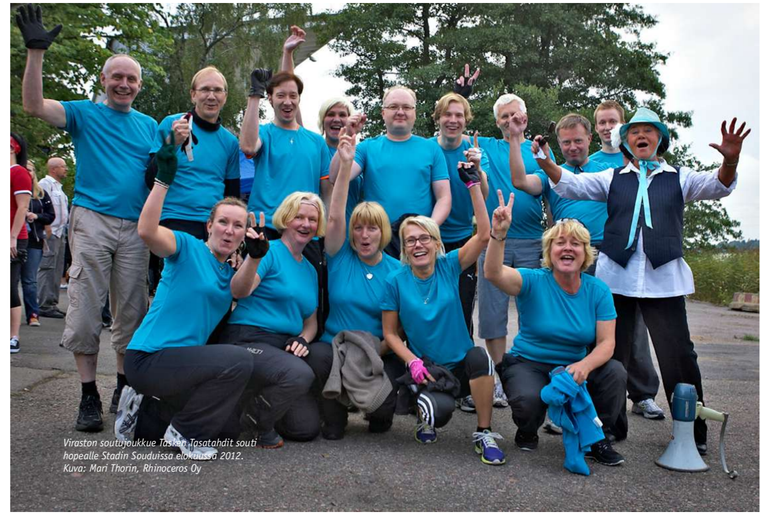
Viraston soutujoukkue Tasken Tasatahdit souti hopealle Stadin Souduissa elokuussa 2012.