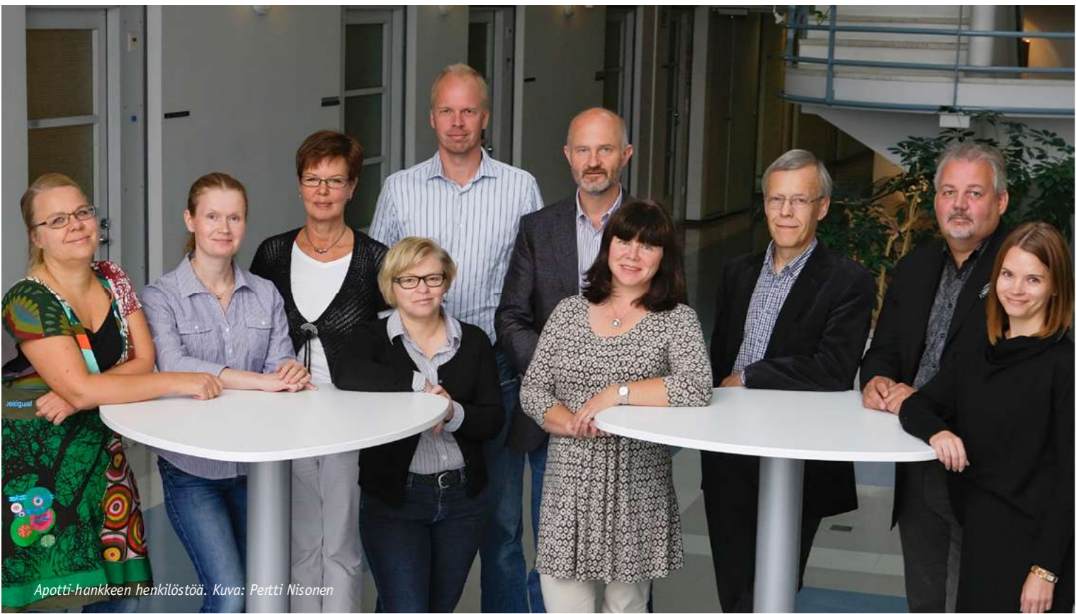
Apotti-hankkeen henkilöstöä.