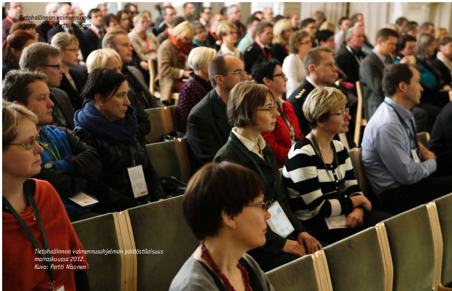
Tietohallinnon valmennusohjelman .