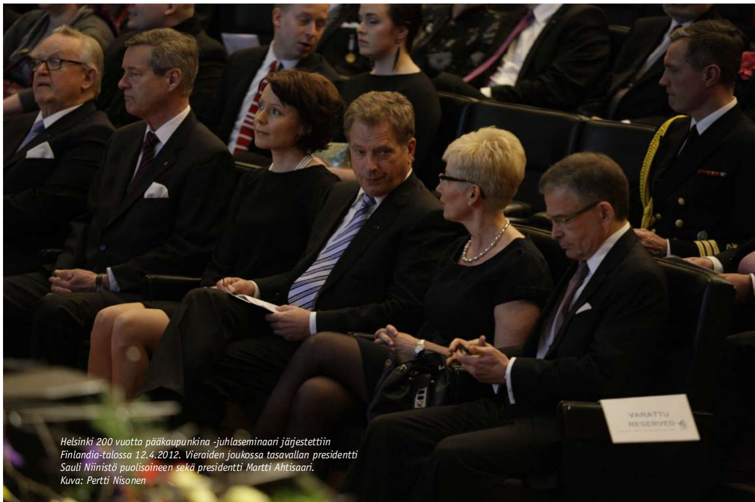
Helsinki 200 vuotta pääkaupunkina -juhlaseminaari järjestettiin Finlandia-talossa 12.4.2012. Vieraiden joukossa tasavallan presidentti Sauli Niinistö puolisoineen sekä presidentti Martti Ahtisaari.