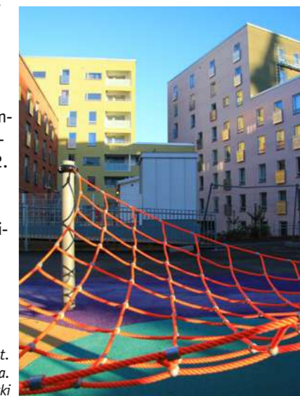
Kalasatamaan valmistuivat ensimmäiset julkiset palvelut. Kuvassa päiväkotikorttelin pihä.

Täydennysrakentamis- ja pientaloprojektien ohella valmisteltiin hitastyöryhmän asioita, hissiprojektin neuvontapalveluja taloyhtiöille ja vastuu kehittyvä kerrostalo -ohjelman toiminnasta.