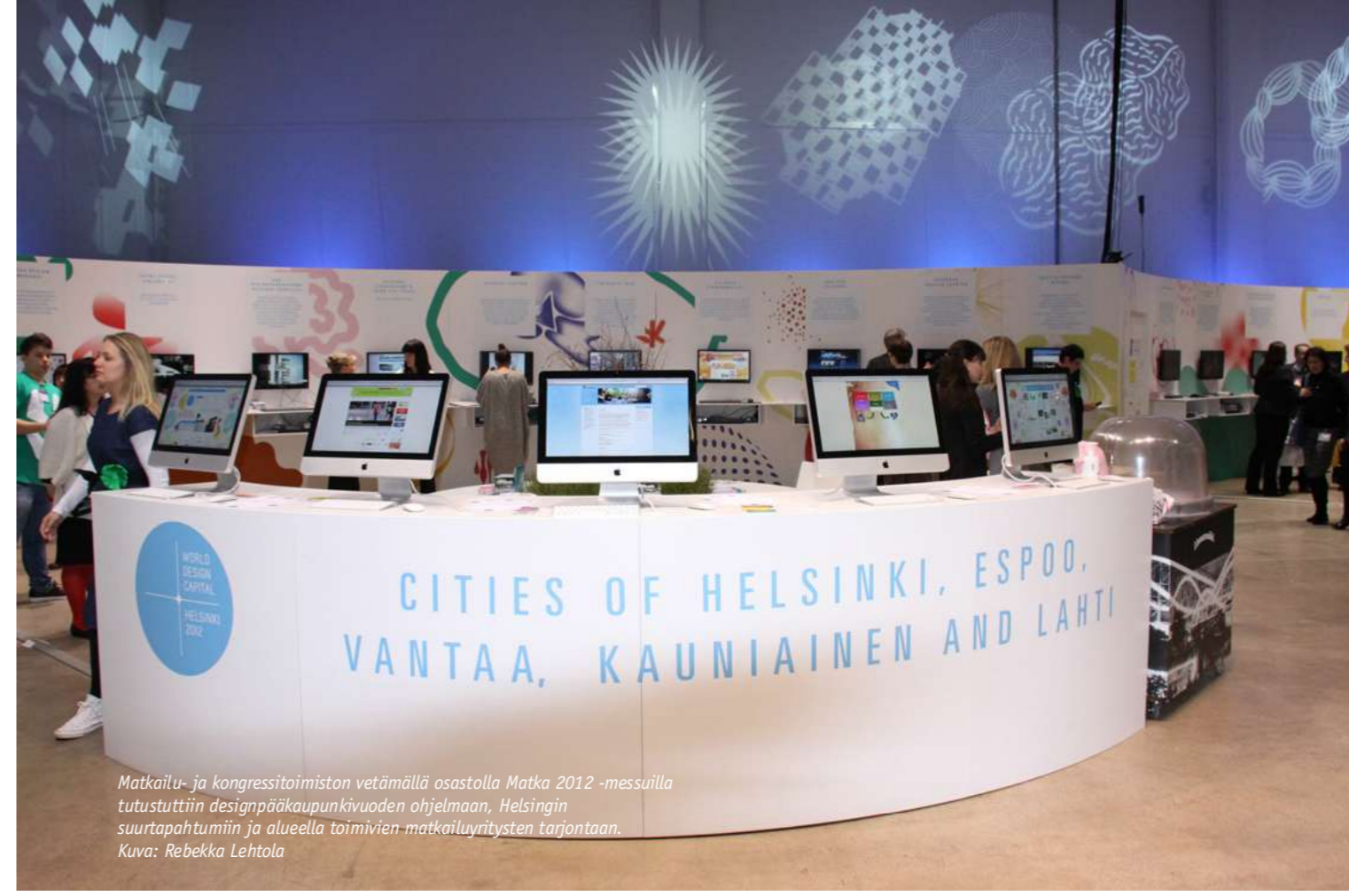
Matkailu- ja kongressitoimiston vetämällä osastolla Matka 2012 -messuilla tutustuttiin designpääkaupunkivuoden ohjelmaan, Helsingin suurtapahtumiin ja alueella toimivien matkailuyritysten tarjontaan.

Helsinki osallistui Sport Accord -kongressiin, joka on urheilujärjestöjen ja -vaikuttajien suurin vuosittainen kongressi- ja markkinointitapahtuma. Sport Finlandin alla esittäytyivät yhdessä Tampereen, Lahden ja Helsingin kaupungit.