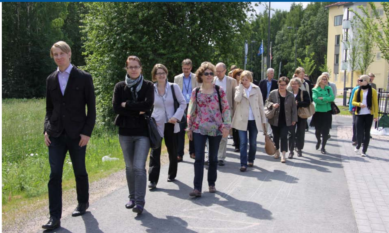
Kuva Mari-Imme Alonen