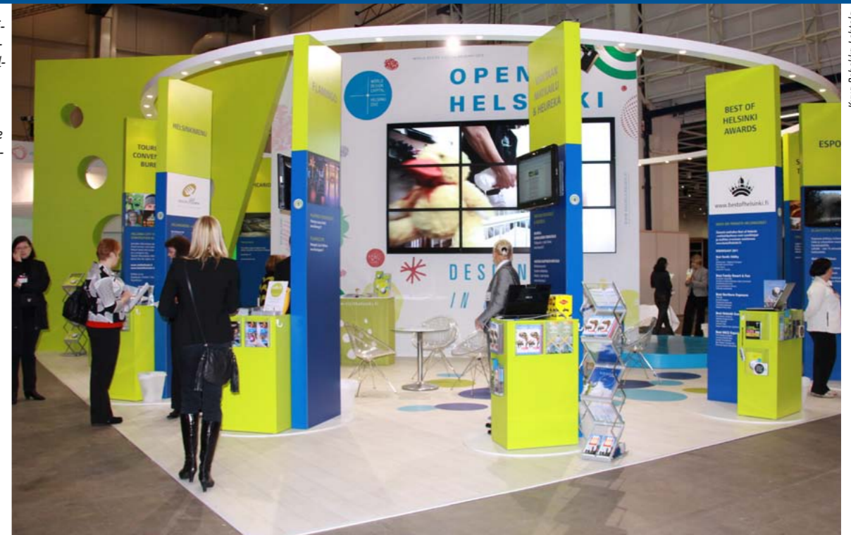
Matkailu- ja kongressitoimiston vetämällä Helsingin seudun yhteisastolla Matka2011-messuilla esitettiin 10 näytteilleasettajaa kumppaneineen. Messuosaston ilme henki tulevaa designpääkaupunkivuotta.