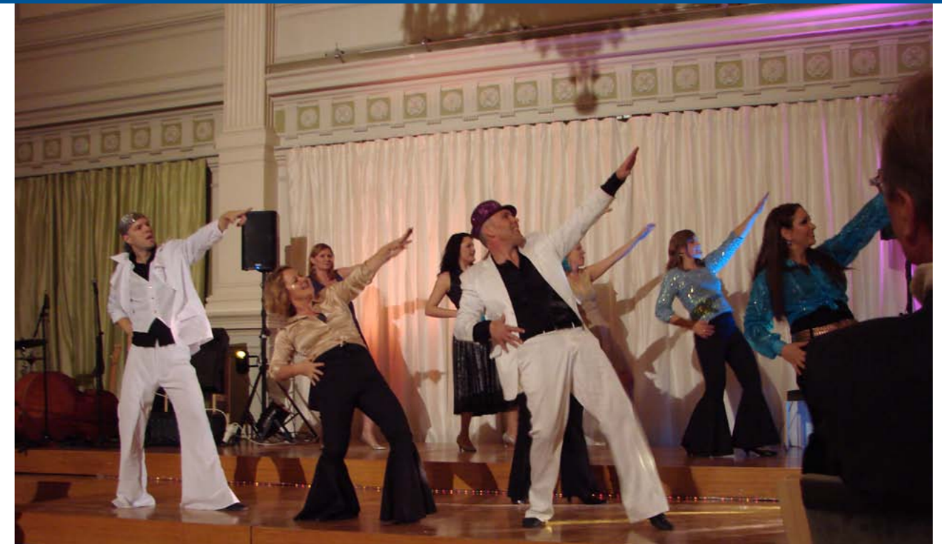
Helsinki City Hall Dancersin tanssiesitys pikkujouluissa kaupungintalolla.

Tyhy-ryhmä järjesti kehityskeskustelujen kehittämiseen liittyvän koulutuksen koko henkilökunnalle. Koulutus sisälsi kaksi samansisältöistä luentoa, joista toinen pidettiin joulukuun alussa 2010 ja toinen tammikuussa 2011. Valmennuksessa pureuduttiin tulos- ja kehityskeskustelujen sisältöön, toteutustapaan ja vuorovaikutuksen rakentamiseen. Henkilökunnalle lähetettiin kehityskeskusteluja koskeva kysely toukokuun lopussa. Kyselyllä kartoitettiin henkilökunnan mielipiteitä kehityskeskusteluista. Kyselyyn vastasi 125 työntekijää. Kyselyn tuloksia käsiteltiin myös viraston johtoryhmässä 19.9.2011 sekä esiteltiin toimintamalli kehityskeskusteluiksi sekä viraston suunnittelun vuosikello. Kyselyn tulokset ja kehityskeskustelumalli esiteltiin henkilöstölle lokakuussa kahdessa samansisältöisessä tilaisuudessa. Tilaisuuksiin osallistui yhteensä 136 työntekijää.