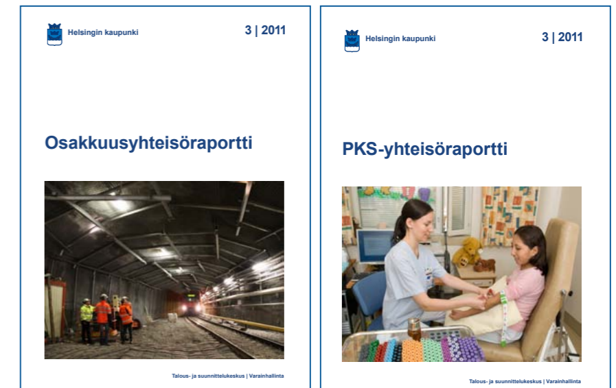
Varainhallinnassa kehitettiin seurantaraporttien luettavuutta.

johdolle. Raporttien tietosisältöä sekä ulkoasua ja luettavuutta kehitettiin. Tytäryhteisöraportteihin sisällytettiin tuottavuustavoitteet ja mittarit. Lisäksi tehtiin uusi ohje harmaan talouden torjumiseksi Helsingin kaupunkikonsernin hankinnoissa.