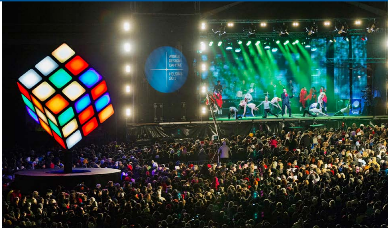
Senaatintorin uudenvuodenjuhlassa avattiin myös World Design Capital Helsinki 2012 ja Helsinki 200 vuotta pääkaupunkina vuosi.