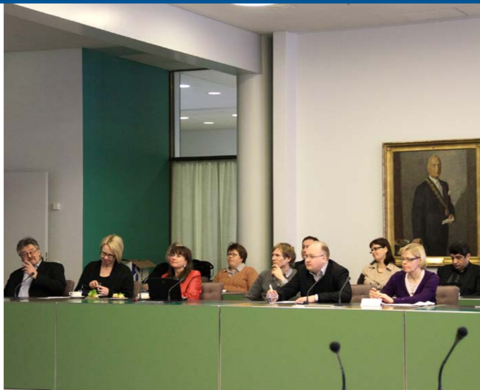
Elinkeinopalvelu pitää osastokokoukset kaupunginhallituksen istuntosalissa.