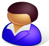
Suunnittelija / konsultti