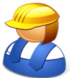
Urakoitsija / työnjohtaja