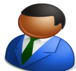
Naapuri / maanomistaja