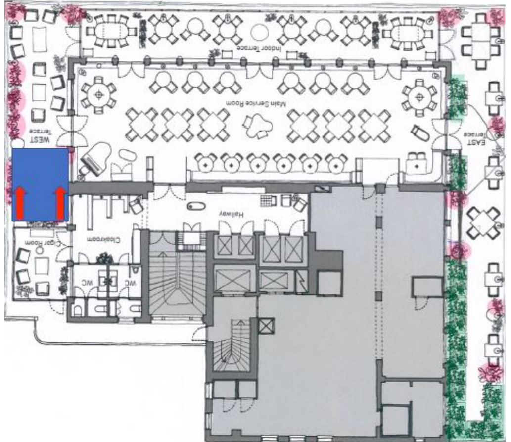
Kuva 2. Äänentoistolaitteiden suuntaus kattoterassilla

Äänentoistolaitteina käytetään 2 x subwoofer (d&b V-Sub), 2 x kokoäänialuekaiutin ( d&b Y10P). Musiikkimelutaso (LAeq) on 10 metrin etäisyydellä melulähteestä 92 dB, 30m etäisyydellä n.80-83 dB ja 100m etäisyydellä n.70-72 dB. Melulle altistuvat eniten toimistorakennukset Eteläesplanadi 16, 14 ja 12 ja Esplanadin puistoalue (kuva 3).