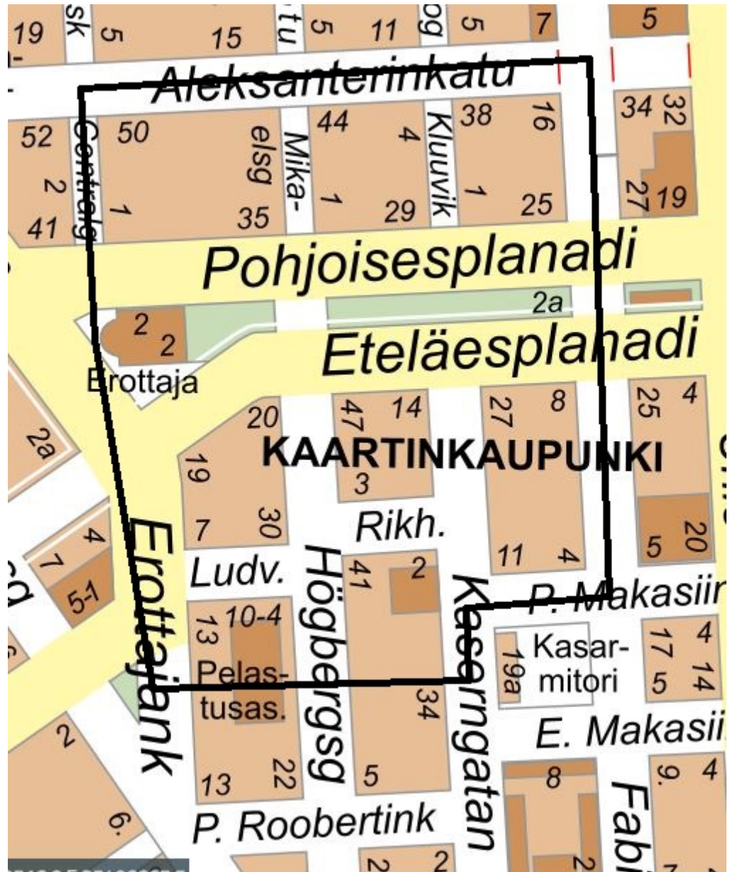
Kuva 1. Tiedotusalue rajattu mustalla viivalla (Määräys 2).