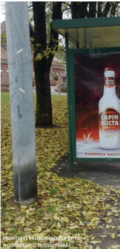
Helsingin kaupungin Harjun nuorisotalon bussipysäkki