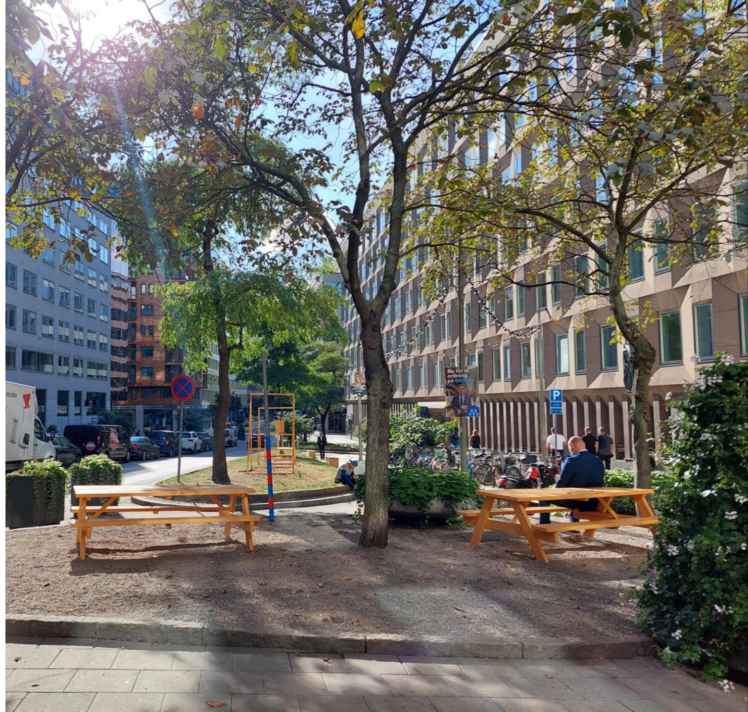
Kuvat: Salla Ahokas 09/2022