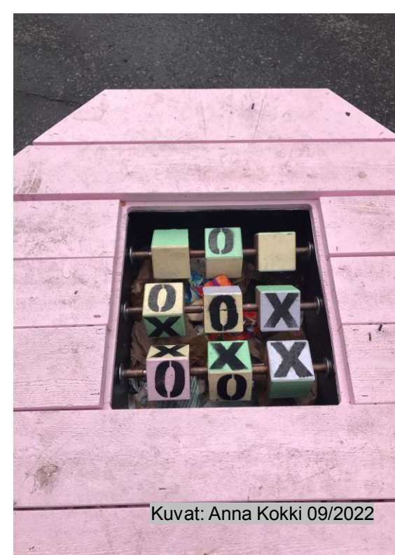
Kuvat: Anna Kokki 09/2022