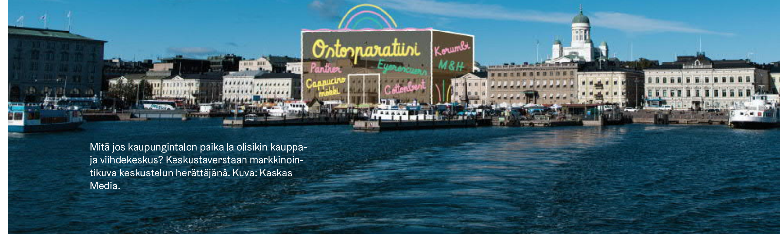
Mitä jos kaupungintalon paikalla olisikin kauppa- ja viihdekeskus? Keskustaverstaan markkinointikuva keskustelun herättäjänä.