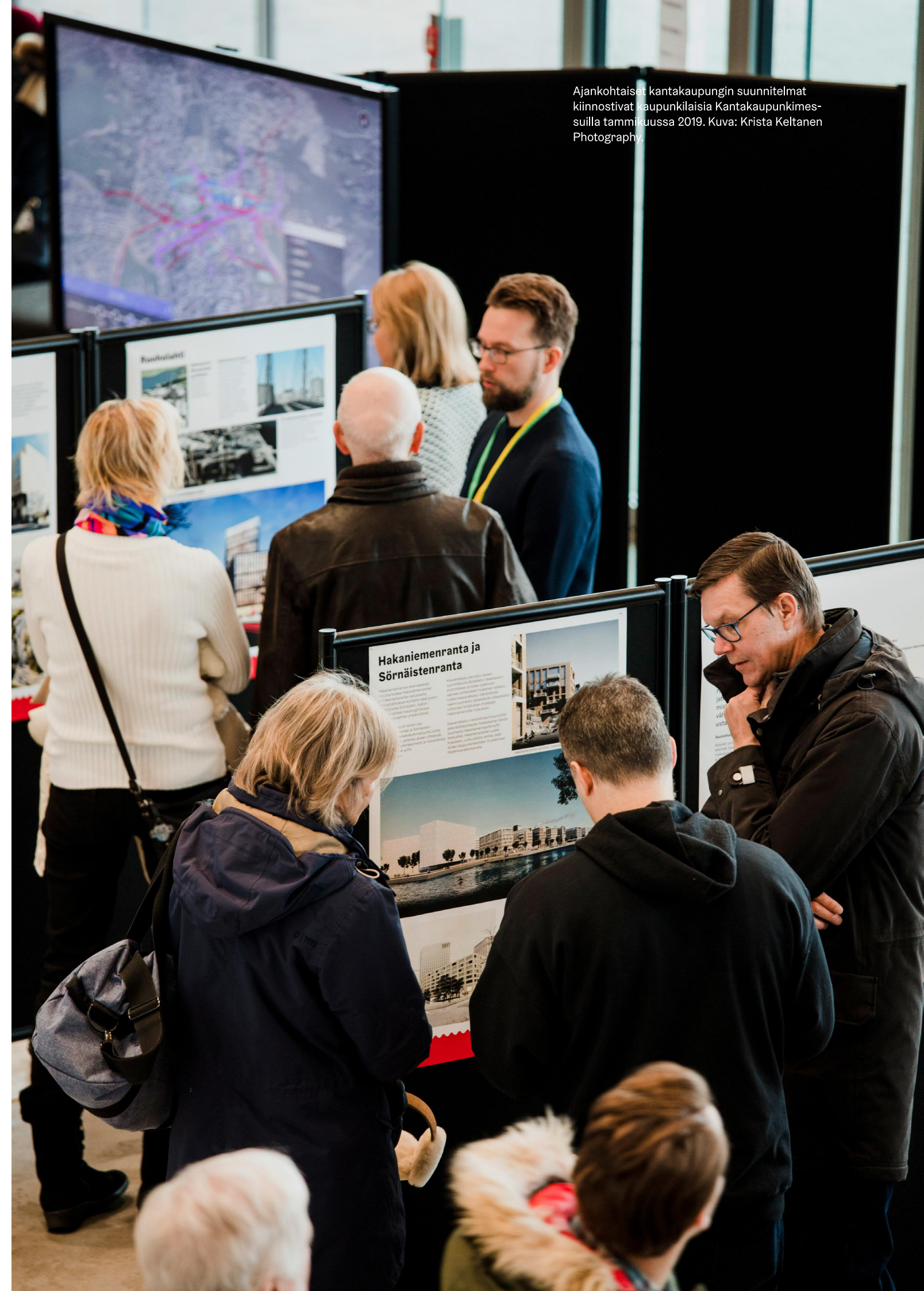
Ajankohtaiset kantakaupungin suunnitelmat kiinnostivat kaupunkilaisia Kantakaupunkimessuilla tammikuussa 2019.