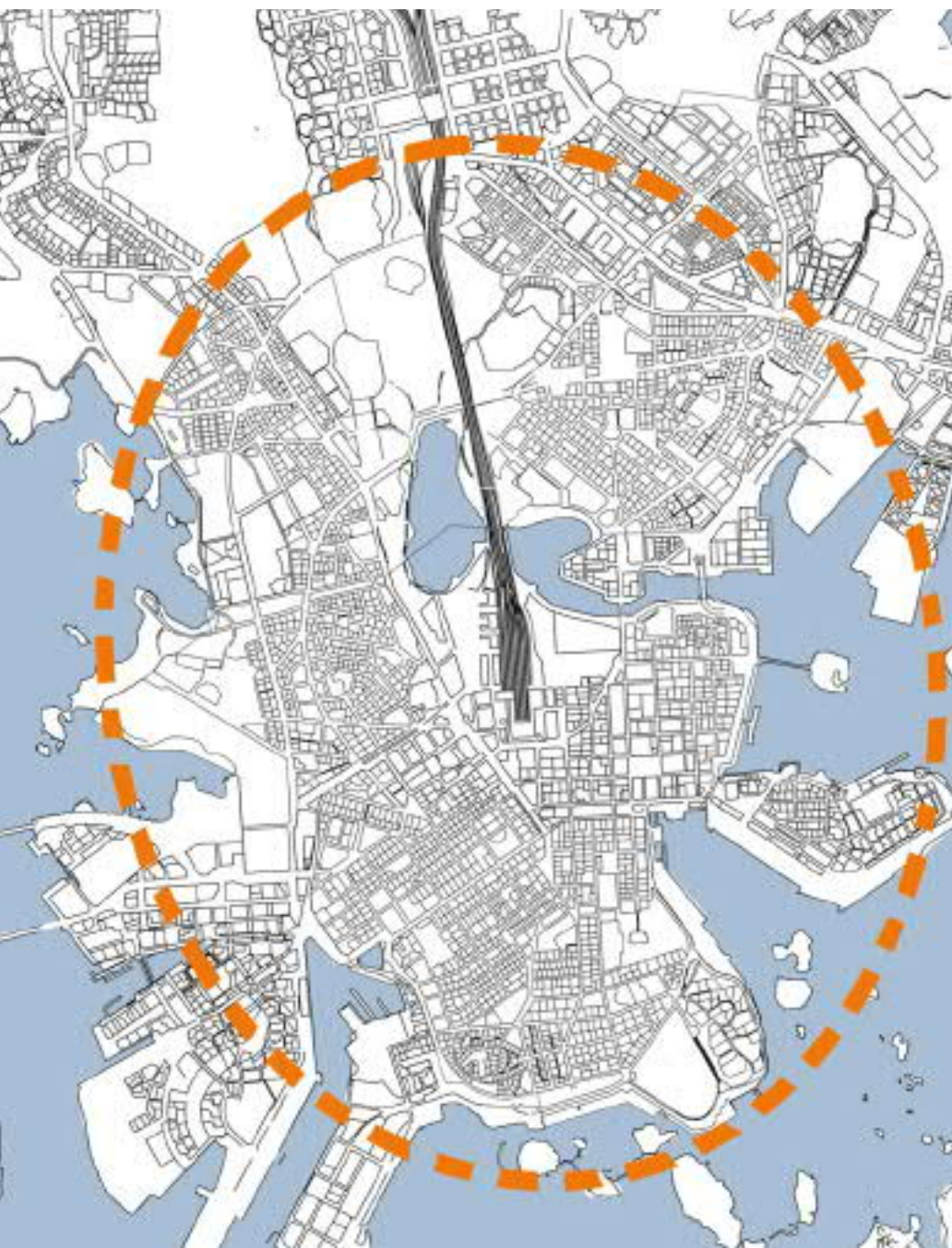
Keskustavisiotyössä keskusta käsitetään laajana kantakaupungin sisältävänä alueena ilman tarkkaa rajausta.