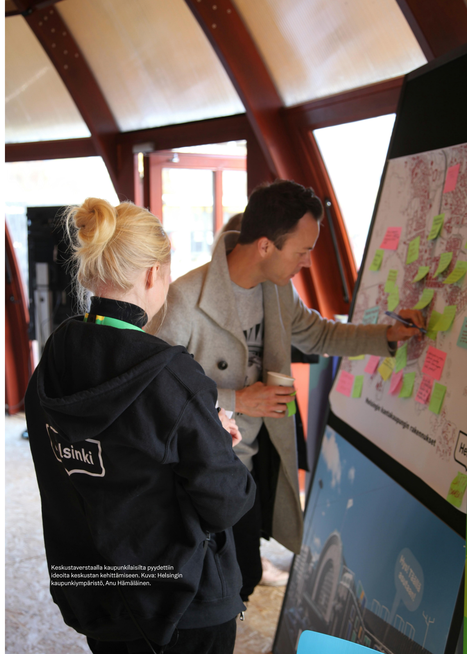
Keskustaverstaalla kaupunkilaisilta pyydettiin ideoita keskustan kehittämiseen.