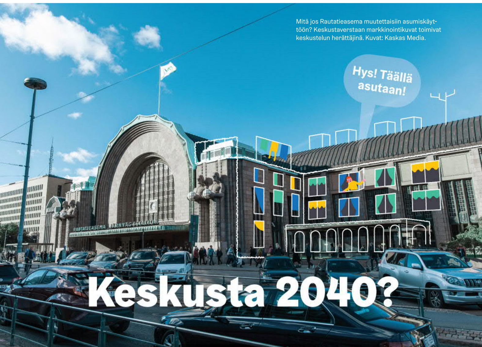
Mitä jos Rautatieasema muutettaisiin asumiskäyttöön? Keskustaverstaalla markkinointikuvat toimivat keskustelun herättäjinä.

Kantakaupunkimessuilla tavoitettiin paljon uusia kävijöitä, jotka eivät olleet varta vasten tulleet messuille vaan kirjastoon. Myös messujen sisällöistä kiinnostuneet