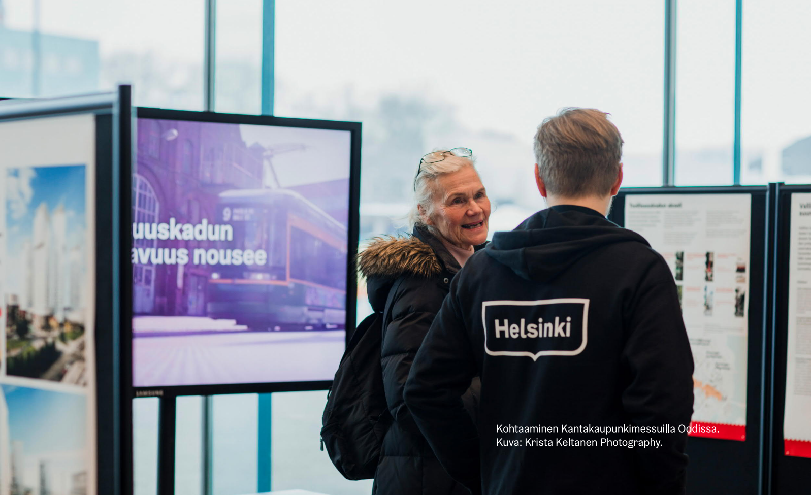
Kohtaaminen Kantakaupunkimessuilla Oodissa.