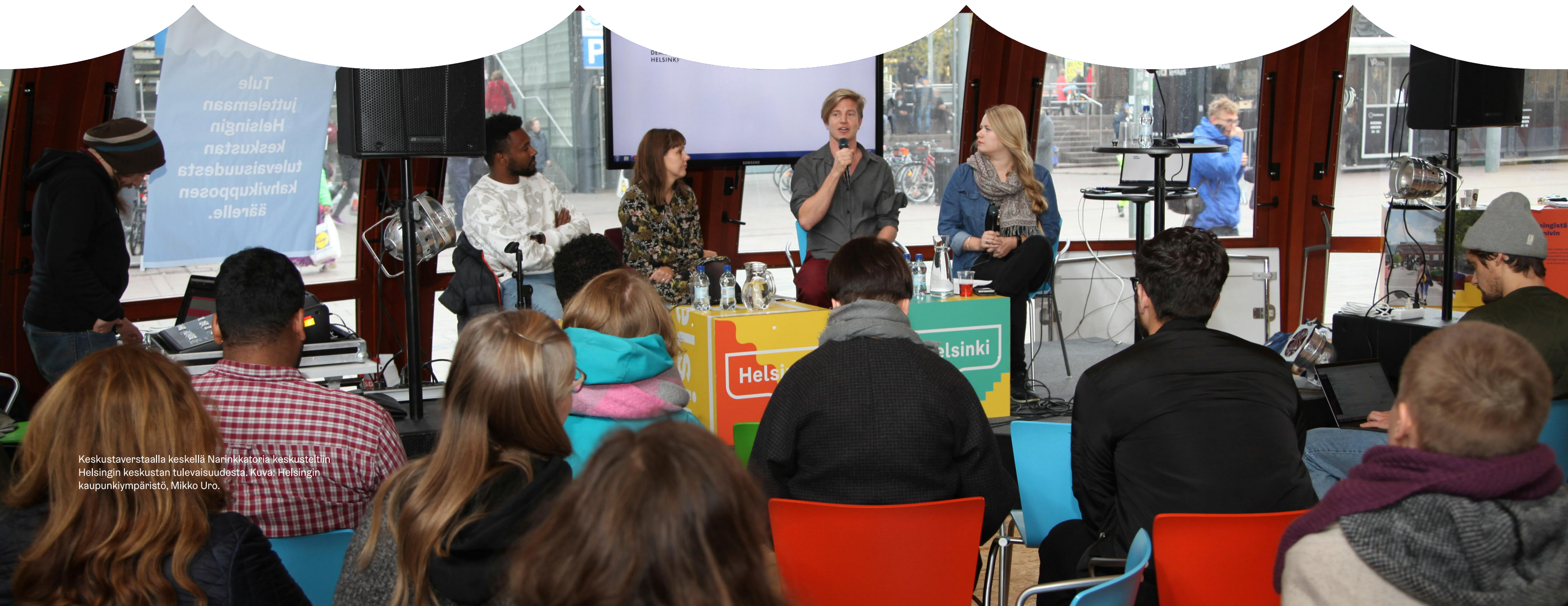
Keskustaverstaalla keskellä Narinkkatoria keskusteltiin Helsingin keskustan tulevaisuudesta.

12. Kaikilla pitäisi olla syy, mutta myös varaa tulla keskustaan. Julkisen liikenteen hinnoitteluun, palveluihin, tapahtumiin ja yöelämään; kaupungin magneetteihin tulisi kiinnittää huomioita.