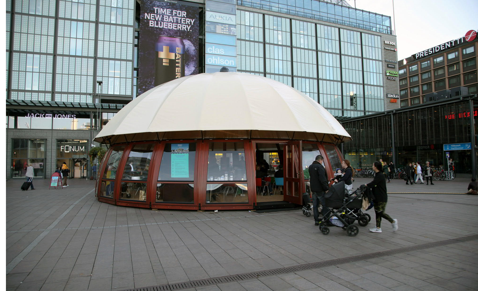
Keskustaverstas-paviljonki lokakuussa Narinkkatorilla.

Visiotyöpajojen lisäksi järjestimme myös muita työpajoja tukemaan Keskustavisiota. Kaikille avoimessa Ideoiden kehityspaja: vetovoimainen keskusta Helsinkiin -tapahtumassa 13.9.2018 Laiturilla esiteltiin ja arvioitiin kävelykeskustan ja maanalaisen kokoojakadun ideakartoituksen tuloksia tavoitteena löytää parhaita ratkaisumalleja. Työpaja oli osa Helsinki Design Week -ohjelmistoa. Yli satapäinen yleisö pääsi kommentoimaan kahdeksan suunnittelu-toimiston ideoita keskustelun lisäksi myös omasta puhelimestaan screen.io -sovelluk-