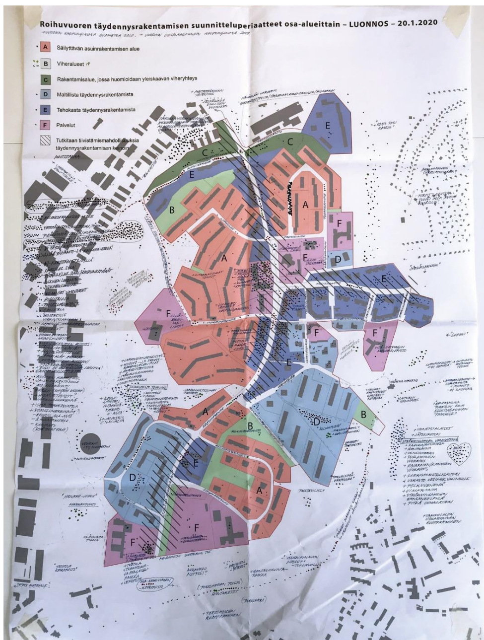
Suunnitteluperiaatteiden luonnos, johon on merkitty erillisinä pisteinä kukin annetuista asukskommenteista. Tarkempi kartta katsottavissa Karttapalvelu.fi :ssa.