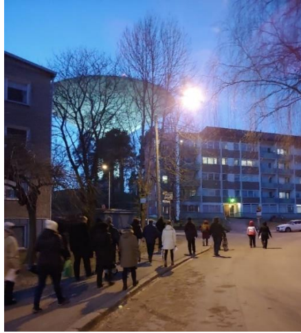
Kaupungin työntekijöitä ja Roihuvuoren asukkaita kaavakävelyllä Tuhkimontiellä 6.2.2020.