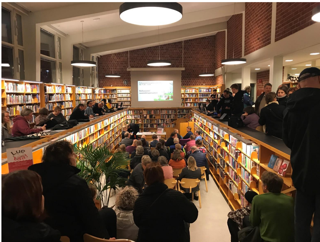
Suunnitteluperiaatteiden esittely- ja työpajatilaisuus Roihuvuoren kirjastossa 30.1.2020 sai paikalle runsaslukuisen ja aktiivisen osallistujajoukon.

Roihuvuoressa on vuosien 2018–2020 aikana tehty useampi asukaskysely. Herttoniemi Vision ja Roihuvuoren aluesuunnitelman teon yhteydessä asukkaiden toiveita kartoitettiin vuonna 2017–2018.