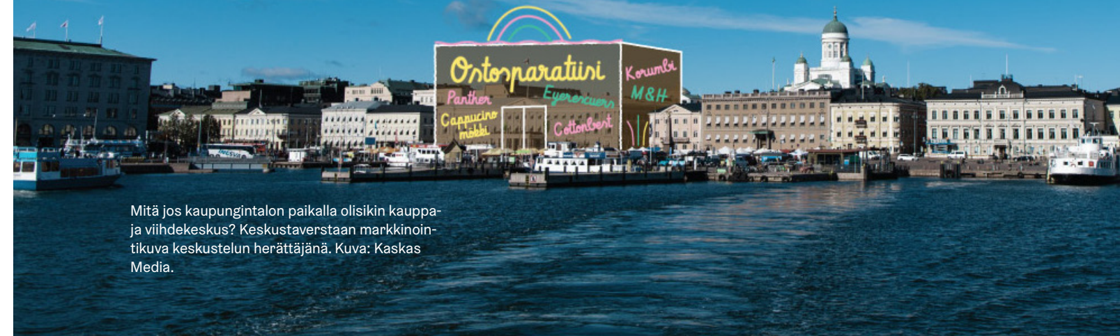
Mitä jos kaupungintalon paikalla olisikin kauppa- ja viihdekeskus? Keskustaverstaan markkinointikuva keskustelun herättäjänä. Kuva: Kaskas Media.