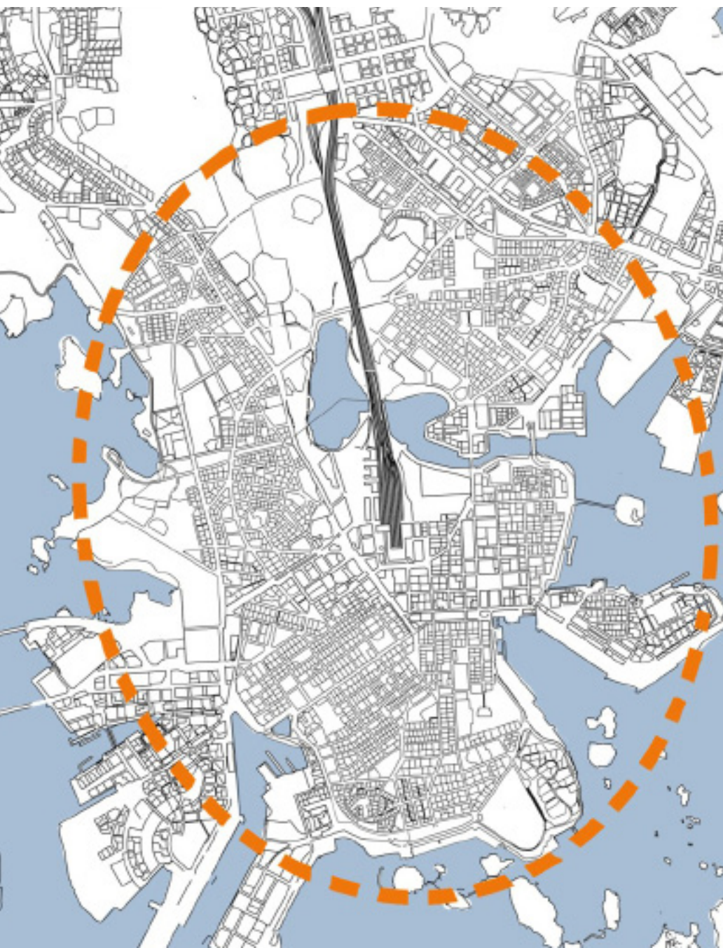
Keskustavisiotyössä keskusta käsitetään laajana kantakaupungin sisältävänä alueena ilman tarkkaa rajausta.