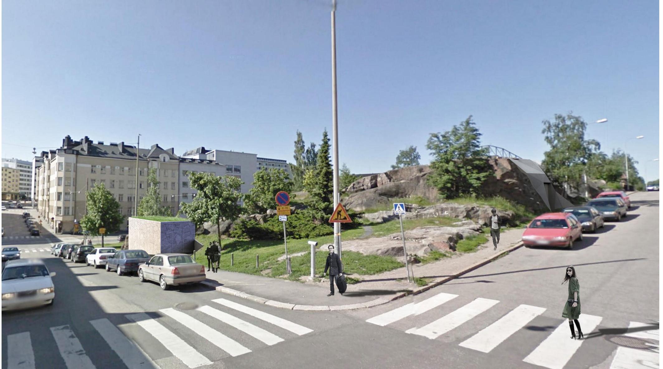
Näkymä Josafatinkadun ja Kirstinkadun risteyksestä