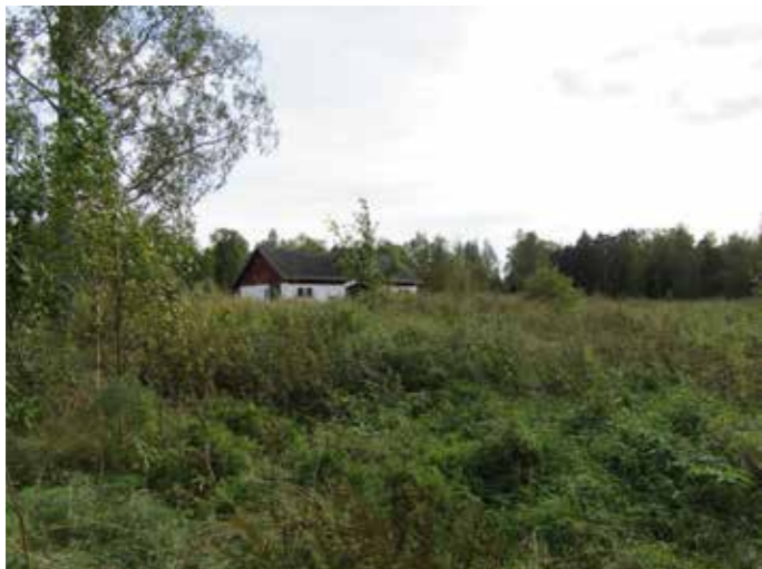
Näkymä entisen laidunalueen yli kohti Skatan tilan navettarakennusta.

Viljelypalstat ja niiden avoimet reuna-alueet säilytetään. Palsta-alueen reunoja ylläpidetään lehtoniittynä, jossa avoimet niityt polveilevat kerroksellisten metsäsaarekkeiden välissä. Samalla tavoin hoidetaan myös alueen luoteisosassa metsän ympäröimää entistä laidunaluetta.