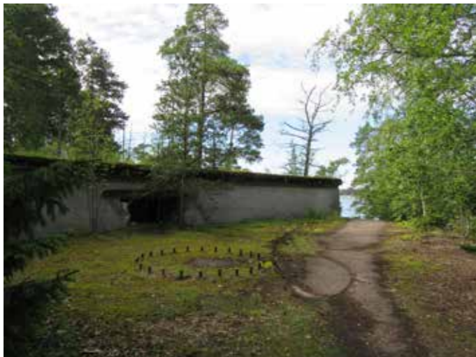
Ensimmäisen maailmansodan aikaiset linnoituslaitteet Skatanniemessä.

Tavoitteet: Virkistyskäyttöä palveleva selänne, jossa on mahdollista päästä merenrantaan. Skatanniemen kärki sekä linnoitteiden ympäristö on esitetty rauhoitettavaksi arvokkaan kasvillisuuden säilyttämiseksi. Jatkossa tätä aluetta hoidetaan suoje- luohjelman tavoitteiden mukaisesti. Tavoitteena on, että linnoituslaitteiden ympäristöä hoidetaan nähtävyytenä ja muistutuksena alueen historiasta. Avoimiin niitty-/laidunalueisiin ja pihapiireihin rajautuvilla reunavyöhykkeillä vesakon kasvu ja leviäminen estetään. Meriharjun huvilalta sekä Skatanniementieltä pidetään avoimena näkymiä merelle. Julkisen ja yksityisten alueiden raja on hahmotettavissa maastossa. Alueen reitistöä hoidetaan ja kehitetään osana Helsingin seudullista rantareittiä.