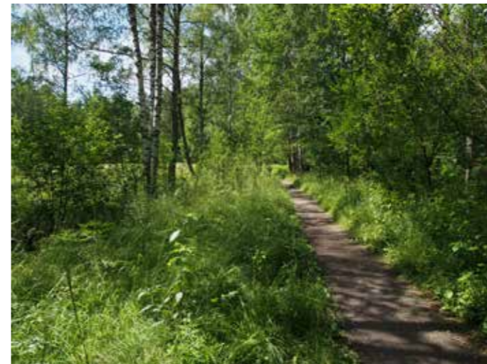
Rehevää pensaikkaa Rudträskin pohjoispuolella.