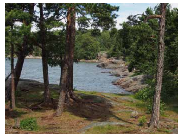
Uutelassa on monipuolista rantamaisemaa. Kuvassa etelärantojen silokallioita ja mäntyjä.