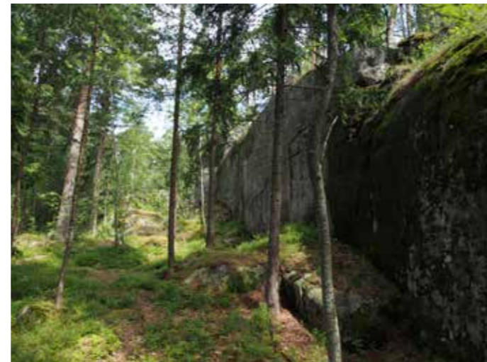
Alueen 7 eteläreunassa on komea kalliojyrkänne.

Tavoitteet: Vaihteleva, moni-ikäinen metsäalue. Suuri osa alueesta on esitetty rauhoitettavaksi monipuolisen metsäalueen ja arvokkaan kasvillisuuden monimuotoisuuden säilyttämiseksi. Ydinaluetta hoidetaan suojeluohjelman tavoitteiden mukaisesti. Niittyihin rajautuvat reunavyöhykkeet pidetään kerroksellisina ja pensas-/pienpuukerroksen leviäminen niityn tai reitin päälle estetään säännöllisin raivauksin. Luontoarvot ja maiseman erityispiirteet huomioidaan virkistyskäytön ohjaamisessa ja polkuverkoston kehittämisessä.