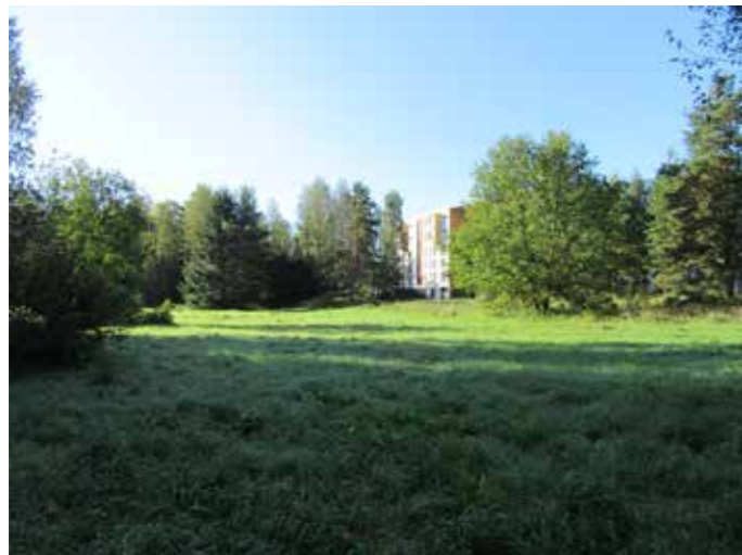
Avointa niittyaluetta Uutelan pohjoisosassa.

Tavoitteet: Niittyalueet pidetään avoimena ja niitettävää aluetta voidaan jatkossa myös laajentaa. Asuin-korttelin läheiset viheralueet käsitellään hoidettuina puistomaisina alueina ja Vuotien viereistä EV-alueita hoidetaan niittynä. Näkymäyhteys Nordsjön kartanolle säilytetään avoimena poistamalla säännöllisesti vesaikkoa ja pensaikkoa Vuotien varresta. Vanhan arboretumin paikalla ylläpidetään erikoispuustoa muistumana alueen historiasta.