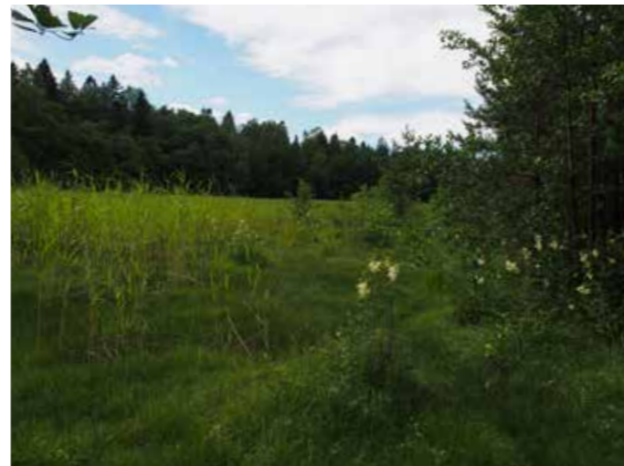
Laguunilahti Särkkäniemen luonnonsuojelualueella.

Tavoitteet: Alue säilytetään luontoarvoiltaan monipuolisena rantavyöhykkeen osana, jossa on myös virkistyskäyttöä ja toimiva polkuverkosto. Suoje- luohjelman tavoitteet ohjaavat alueen hoitoa.