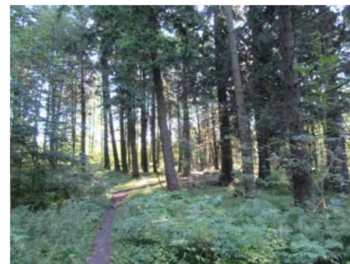
Douglaskuusia monilajista puustoa kasvavalla metsä-alueella Uutelan pohjoisosassa.