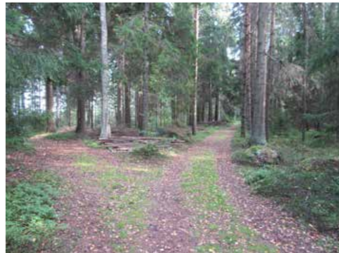
Polkuverkostoa Uutelan koillisosassa.