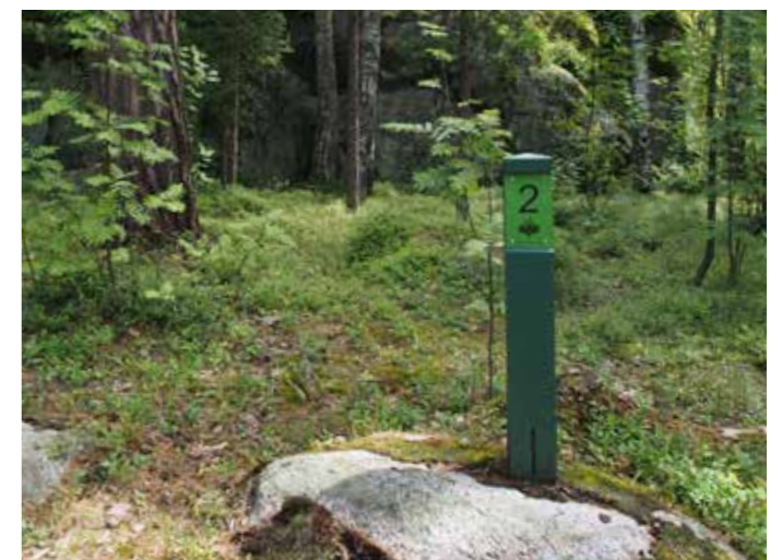
Luontopolkurastin numeroitu pylvä.