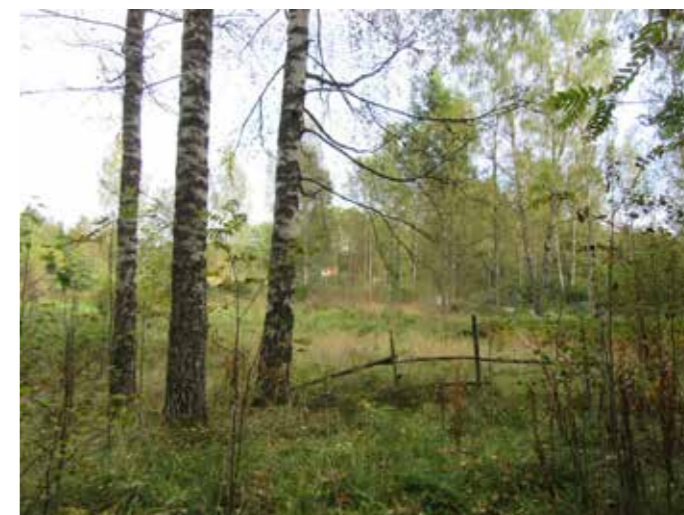
Uutelan keskiosat ovat viljelylaakson vanhaa laidunmaisemaa, joka pyritään säilyttämään avoimena.