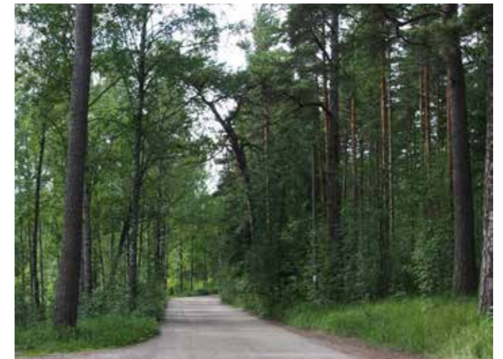
Uutelantietä reunustavaa männikköä.