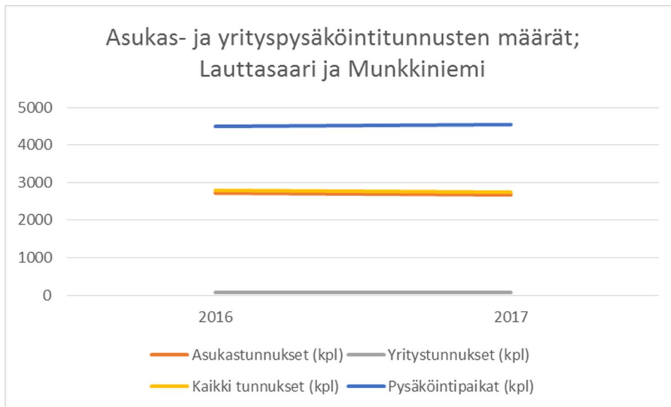
Kuva 2. Asukas- ja yrityspysäköintitunnusten lukumäärät Lauttasaarella ja Munkkiniemessä vuosina 2016 ja 2017

Asukas- ja yrityspysäköintijärjestelmä otettiin käyttöön Lauttasaarella ja Munkkiniemessä vuonna 2015, joten tietoja on saatavilla vuosilta 2016 ja 2017. Tiedot on esitetty kuvassa 2. Asukas- ja yrityspysäköintiin soveltuvia paikkoja on selvästi enemmän kuin lunastettuja tunnusia. Yrityspysäköintitunnusten määrä on matala vain 70 - 80 tunnusta molemmat alueet yhteensä. Lauttasaaren ja Munkkiniemen alueilla on noin 31 000 asukasta, joten asukas-pysäköintitunnus on noin 9 % asukkaista.