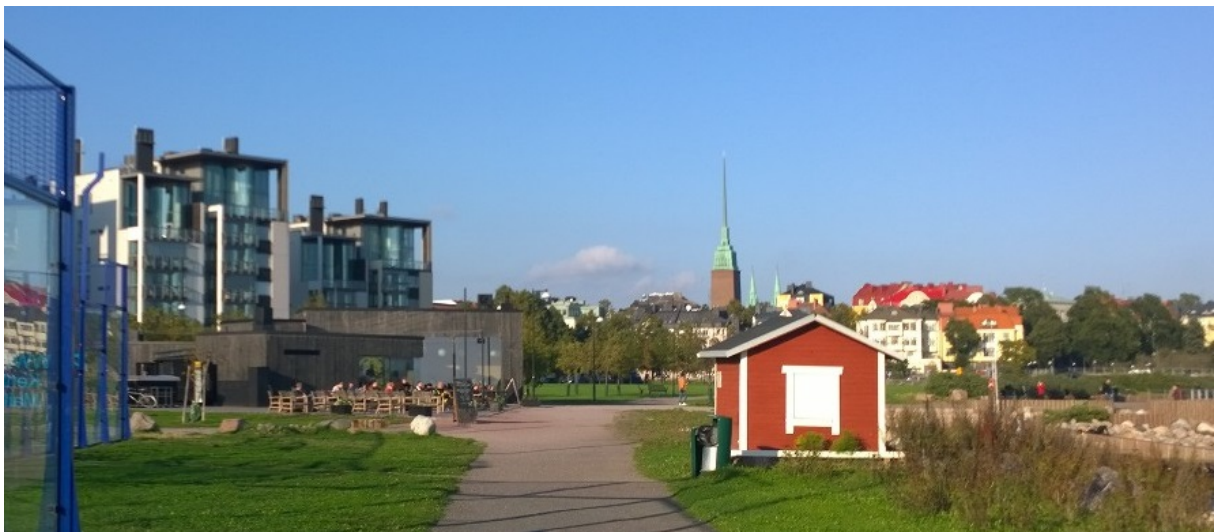
Hernesaaren ranta toimii jo nykyisin kaupunkilaisten vapaa-ajan paikkana

Kantakaupunkimaista asuinalueen ilmettä ei saada aikaan, mikäli alueelle ei rakenneta riittävästi kivijalkaliiketiloihin. Kantakaupunki asuinalueena houkuttelee urbaaneja kaupunkilaisia, joiden elämäntapaan kuuluu kaupallisten lähipalveluiden hyödyntäminen. Kaupunkipalveluille on enemmän kysyntää kuin esimerkiksi lähiöissä tai pientaloalueilla ja riittävä tarjonta edesauttaa kysyntää.