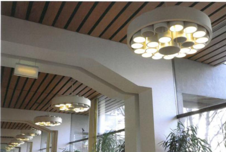
Alkuperäiset valaisimet ja puualakatto