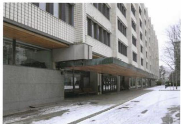
Korttelipuiston puoleista julkisivua

" Rakennuksen päätyjulkisivut ikkunajakoineen ja tuuletusritilöineen tulee säilyttää alkuperäistoteutuksen mukaisina. Pohjakerrokseen saa avata Mechelininkadun puoleiseen pätyyn liiketoiminnan edellyttämiä ikkunoita."