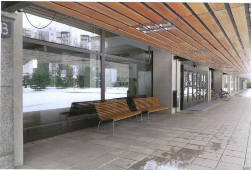
Sisääkäyntikatot ja tuulikaappi

"Pohjakerroksen säilytettäviin julkisivun osiin luetaan messinkikarmiset suuret maisemaikkunat, ulko- ovet ja matalat yläikkunat; pohjakerroksen graniittilaattaverhous sekä alkuperäiset tuulikaapit sekä si- säkäyntikatot yksityiskohtineen."