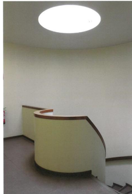
Keskisen porrashuoneen kierreporras