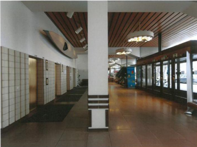
Näkymä sisäänkäyntiaulasta ravintolan suuntaan

"Rakennuksen arvokkaisiin säilytettäviin sisätiloihin luetaan pohjakerroksen sisäänkäyntiaulan ja ravintolan muodostama tilasarja mukaan lukien rinnakkaiset viistetyt kantavat palkit, aulan puualakatto, joka jatkuu julkisivun ulkopuolelle katoksena, lattiamateriaali sekä tilaan kuuluvat alkuperäiset valaisimet. Rakennuksen säilytettäviin sisätiloihin kuuluvat myös rakennuksen kolme pääporrashuonetta."