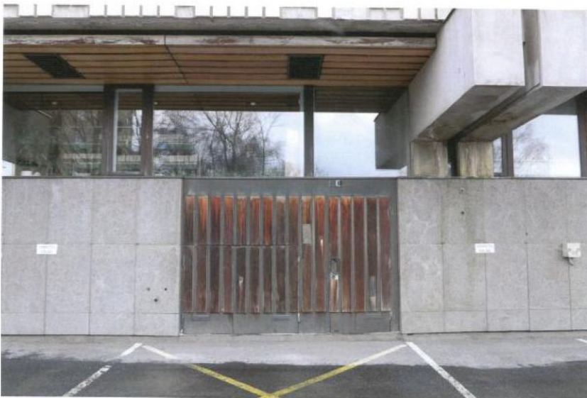
Pihakannen ulko-ovi ja seinän graniittilaattaverhous