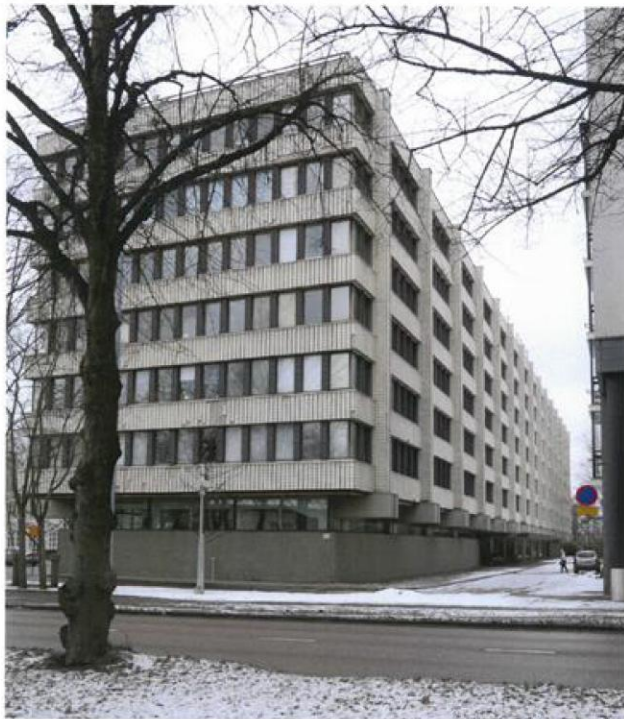
Mechelininkadun puoleinen päätyjulkisivu