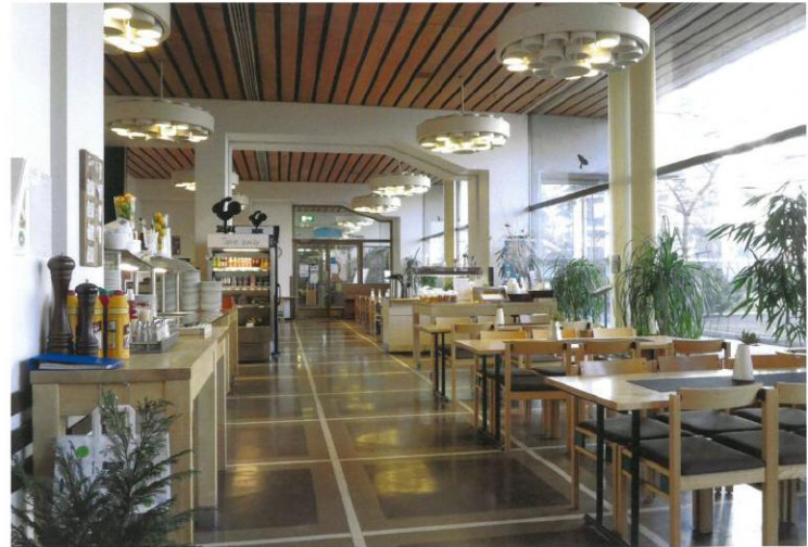
Ravintolatila ja suuret maisemaikkunat