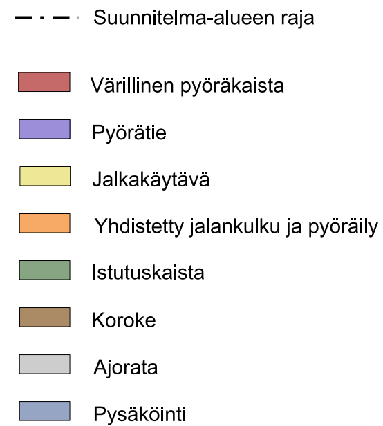
poikkileikkaus A - A