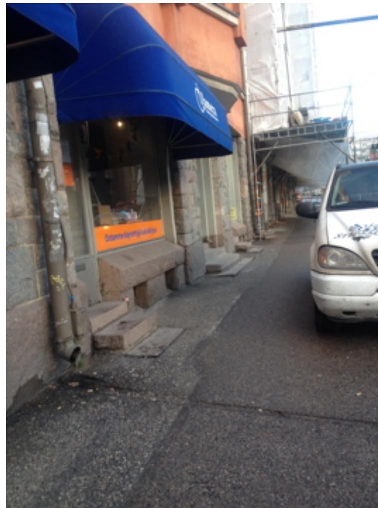
Kuva 1. Kirjakauppa toteaa myös suurimmaksi haasteekseen jalkakäytävälle pysäköivät autot, jotka ovat siinä kaupan mukaan usein luvattomasti koko päivän.

”Kun puretaan tavaraa tai tuodaan niin kylhän näitä jalkakäytäviä käytetään. Kyllä toi meidän edusta on aika paljon käytössä. Kyllä siinä parikyt autoa päivän mittaan pysähtyy. Joko tuo tavaraa tai vie tavaraa.” (Kodinkoneliike)