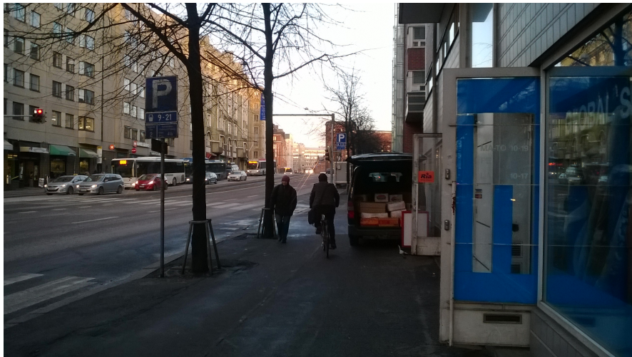
Kuva 3. Jalkakäytävällä ajavat pyöräilijät aiheuttavat vaaratilanteita.

jotakin parannuksia, ennen kuin uusia onnettomuuksia tapahtuu. Lounasravintolan yrittäjä kertoi, että kerran parkissa oleva kuljettaja avasi auton oven suoraan pyöräilijän eteen. Myös muut yrittäjät ovat havainneet vaaratilanteita tai kuulleet tapahtuneista onnettomuuksista, joissa pyörä on ollut osallisena. Koetaan, että tilanteelle on tehtävä joitakin parannuksia, ennen kuin uusia onnettomuuksia tapahtuu. Jalkakäytävällä pyöräilijöitä myös ymmärretään, sillä autojen seassa bussikaistalla ajaminen nähdään vielä vaarallisempana kuin jalkakäytävällä.