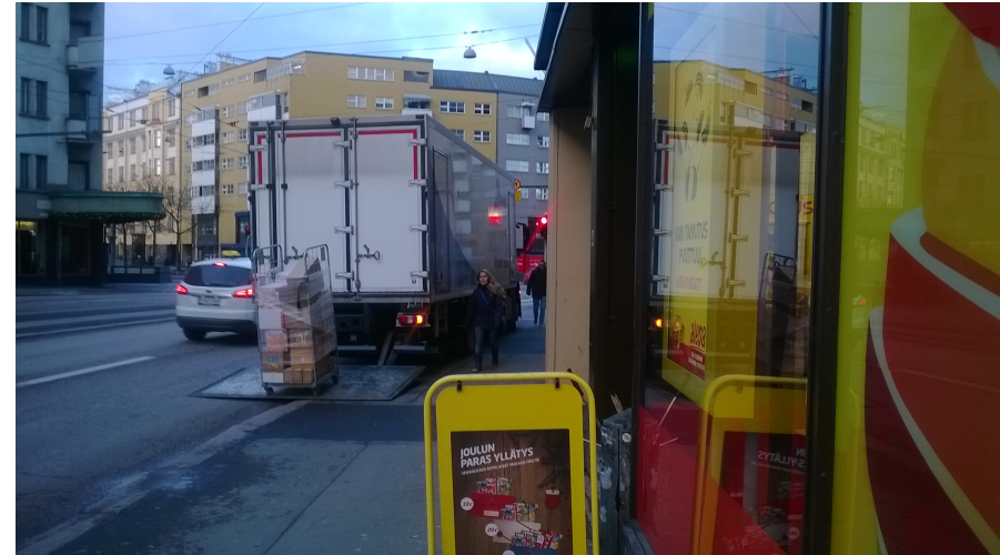
Kuva 2. 24-h elintarvikekaupan toimitukset ovat melko raskaita.

päästä, ja siinähan nyt ei oo mitään järkeä.” (Baari)