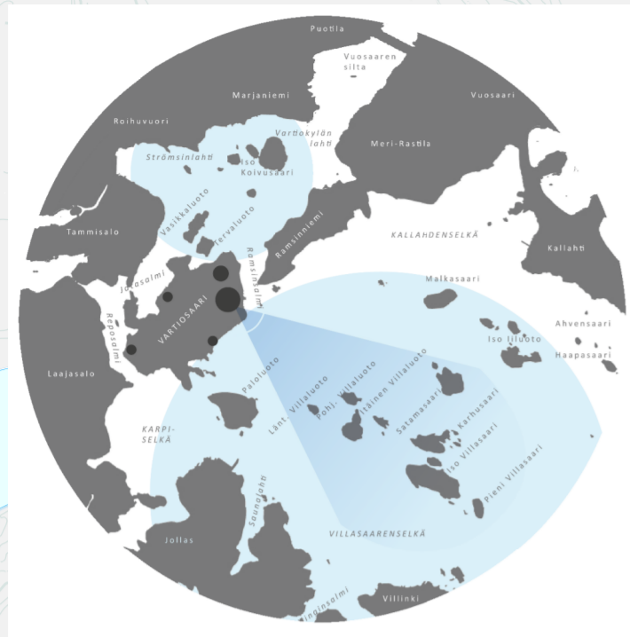
Vartiosaaren sijainti ja näkymät