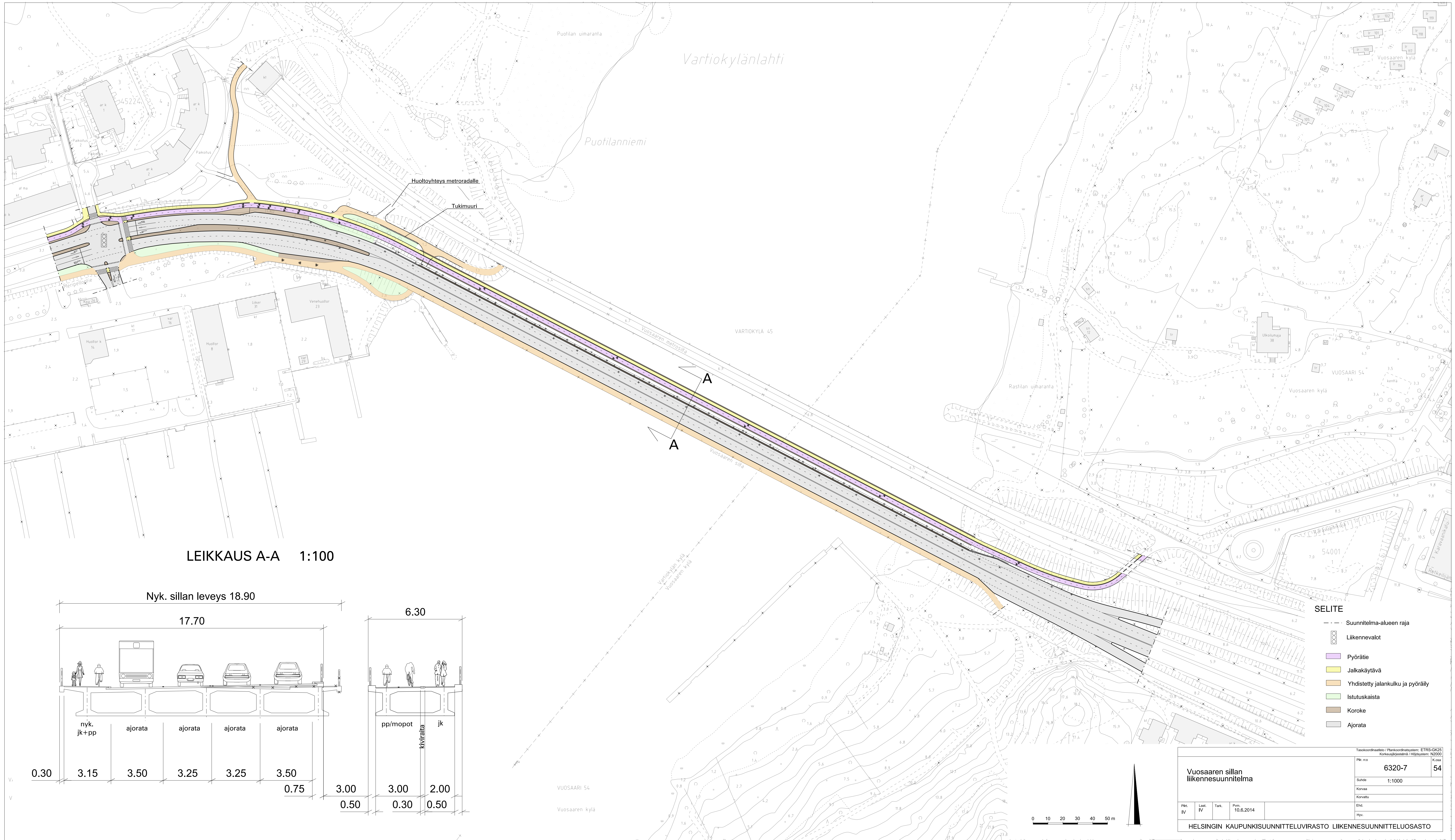
LEIKKAUS A-A 1:100