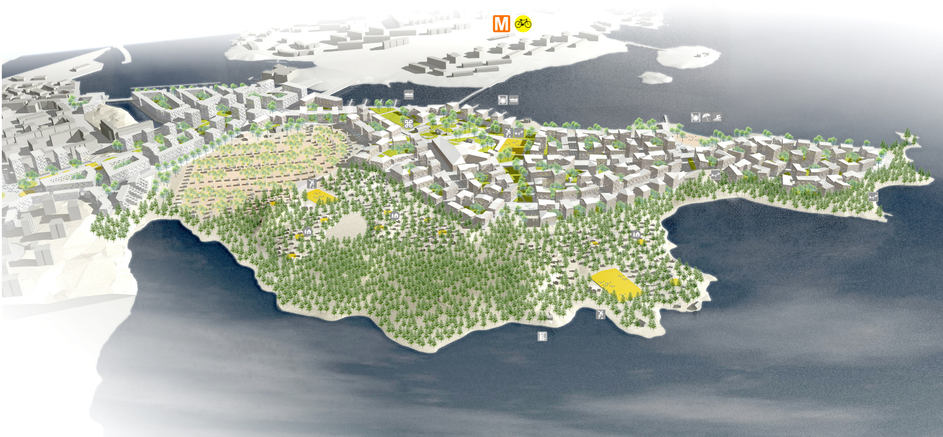
Kivinokan osayleiskaavan suunnitteluperiaatteet, näkymä pohjoisesta