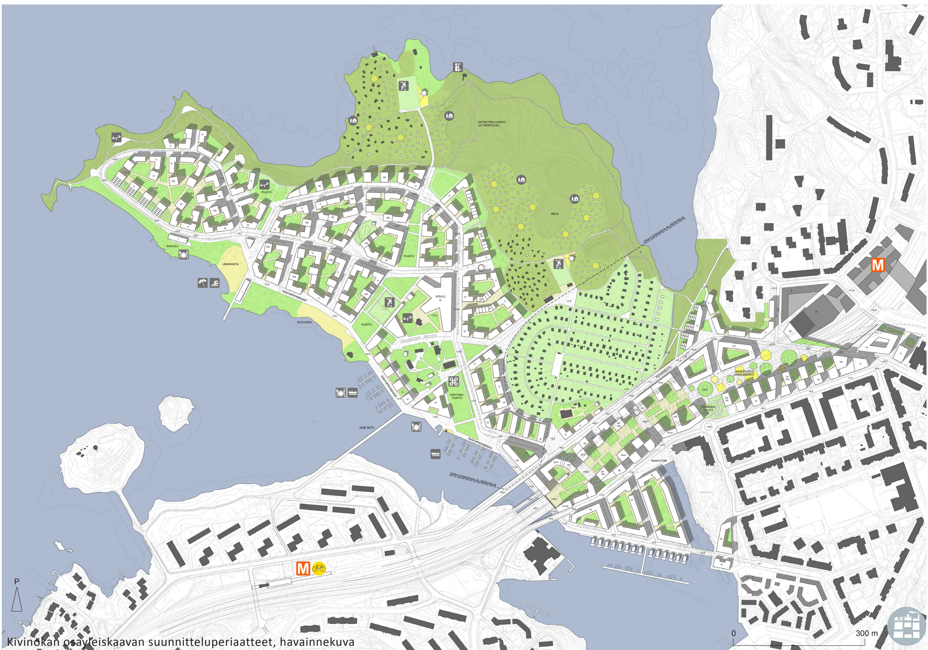
Kivinkangas osayleiskaavan suunnitteluperiaatteet, havainnekuva