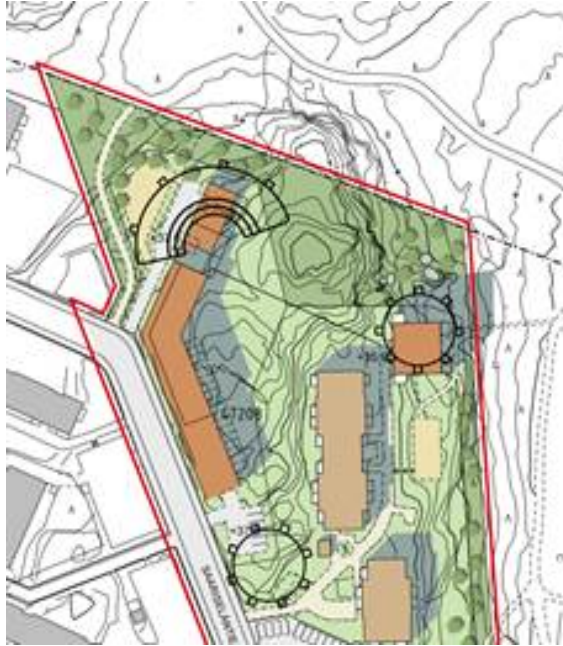
Viitesuunnitelman rakennukset sijoitettuna havainnekuvaan

Jos rakennukset Vantaan rajan tuntumassa sijoitettaisiin viitesuunnitelman mukaan, virkistysalue supistuisi ja sen käyttömahdollisuudet mm. kiipeilyyn heikentyisivät.