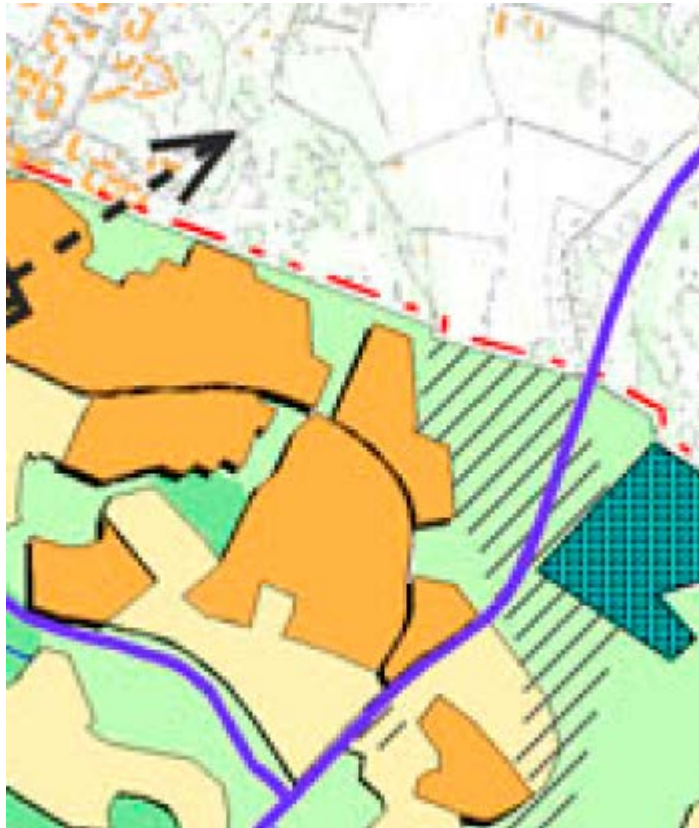
Ote yleiskaava 2002:sta

Rakennusten sijoittaminen kadun varteen on rakennetussa kaupunkiympäristössä luontevaa. Kallioiden lakialueet säilyvät rakentamattomina joko virkistysalueella tai osana tontteja.