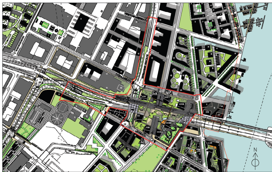
KALASATAMAN KESKUS HAVAINNEKUVA 5/2011

Helsingin kaupunkisuunnitteluvirasto Asemakaavoitus / IRA-projekti Tuomas Hakala / Katja Reevuori