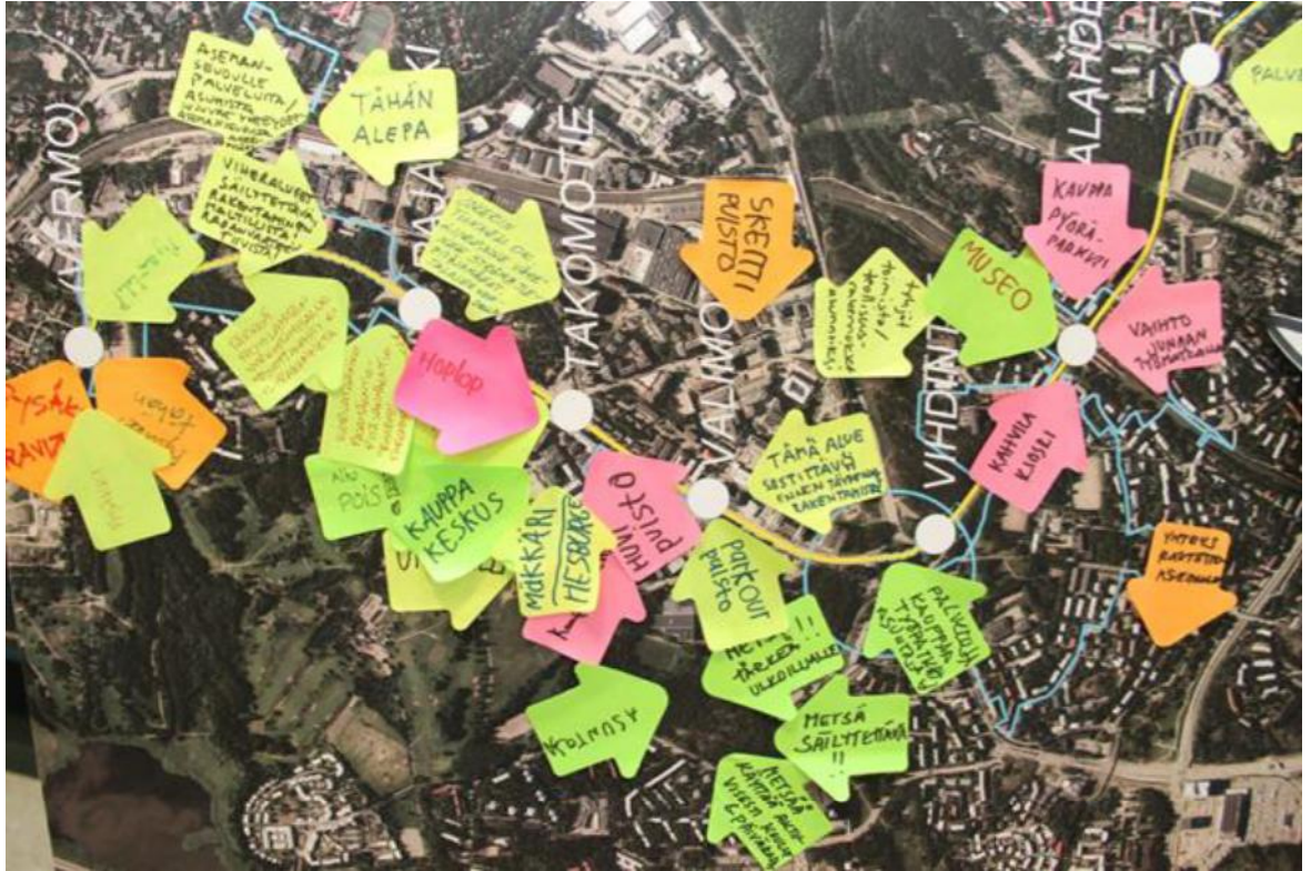
Kuva: Länsi-Helsingin Jokerimessuilta isolle ilmakuvalle kerättyjä kommentteja.

Myllärintien pysäkin kohdalle toivottiin liityntäpysäköintiä, palveluita sekä asuntoja, mutta aluetta korostettiin myös tärkeänä virkistyspaikkana. Oulunkylässä kommentteja ei tullut juuri lainkaan, sillä vastaava työpaja oli jo pidetty Oulunkylässä helmikuussa.