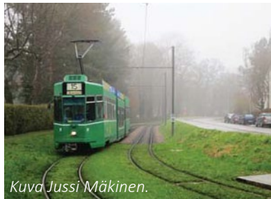
Kuva Jussi Mäkinen.