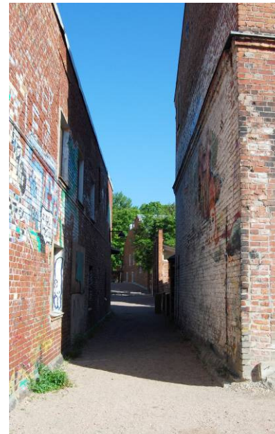
Kuva 5: Rakennuksen idän puoleinen kuja.