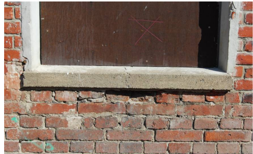
Kuva 8: Tiilimuurauksen vaurioita eteläjulkisivussa. Vesipellitykset puuttuvat useasta ikkuna-aukosta.