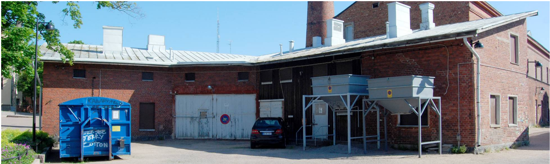
Kuva 2: Julkisivu lounaaseen.