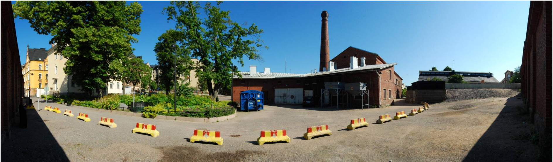
Kuva 1: Rakennuksen nykyinen pihapiiri rajautuu etelässä entisen vankilan muuriin, lännessä puistoon ja pohjoisessa pallokenttään.