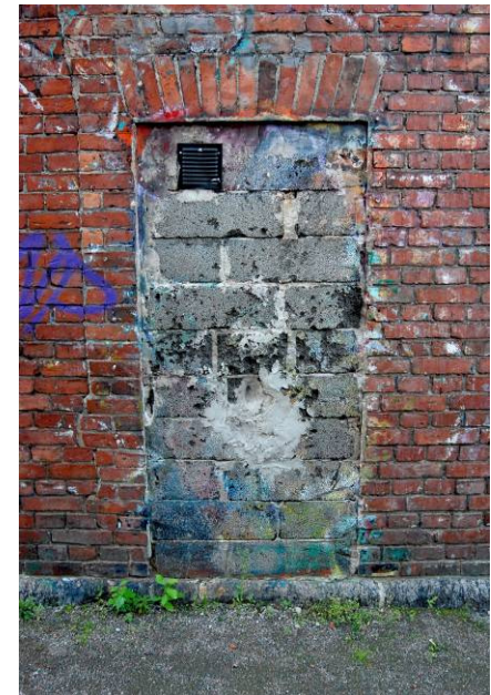
Kuva 6: Umpeen muurattu oviaukko itäjulkisivussa.