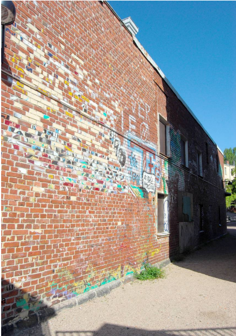
Kuva 3: Talonvaltauksen aikana syntyneitä graffiteja on yhä nähtävillä rakennuksen itäisellä julkisivulla.