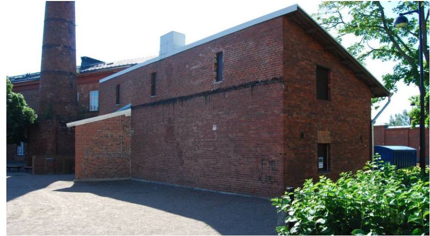
Kuva 4: Näkymä luoteesta.