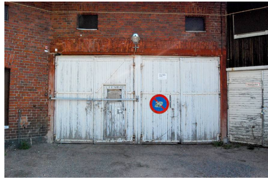
Kuva 9: Rakennuksen ulko-ovet ovat huonokuntoisia.