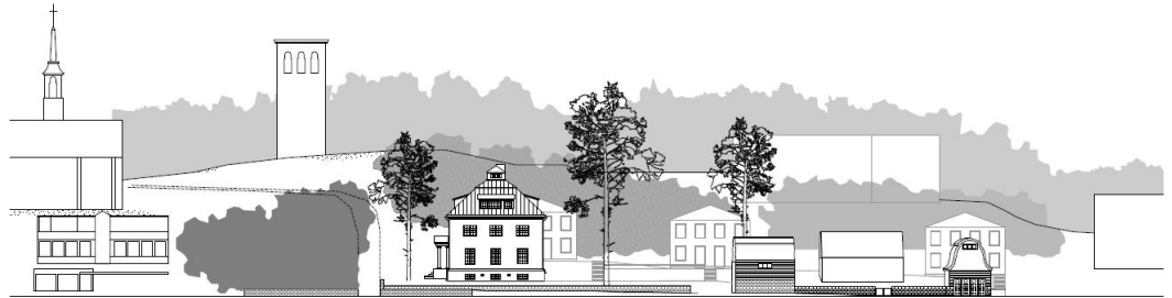
Julkisivu Kulosaarentielle. Kuva: "Kulosaarentie 42 ja 44. Viitesuunnitelma huvilakokonaisuudesta vanhojen pihapiirien taustalle" Arkkitehdit Rudanko + Kankkunen Oy