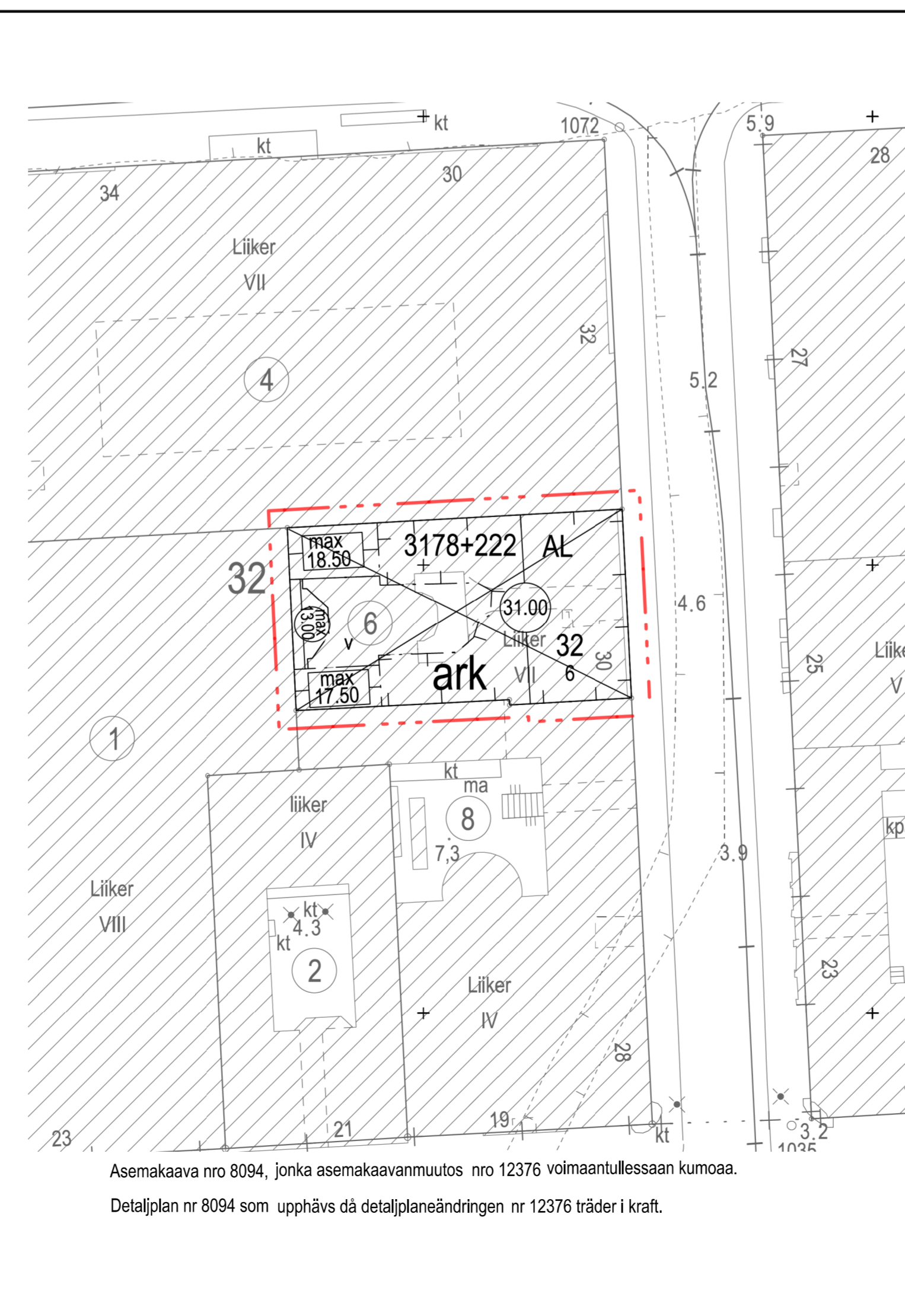
Asemakaava nro 8094, jonka asemakaavanmuutos nro 12376 voimaantullessaan kumoaa. Detaljplan nr 8094 som upphävs då detaljplaneändringen nr 12376 träder i kraft.