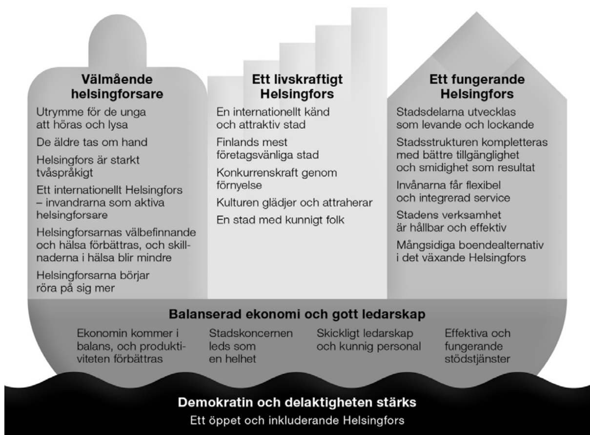
Bild 1. Mål