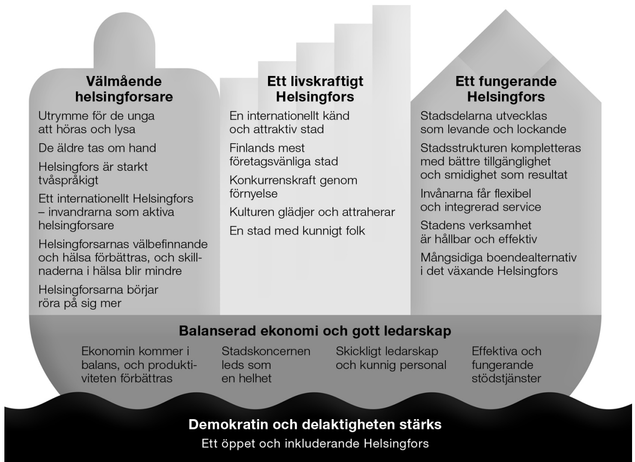
Bild 1. Mål