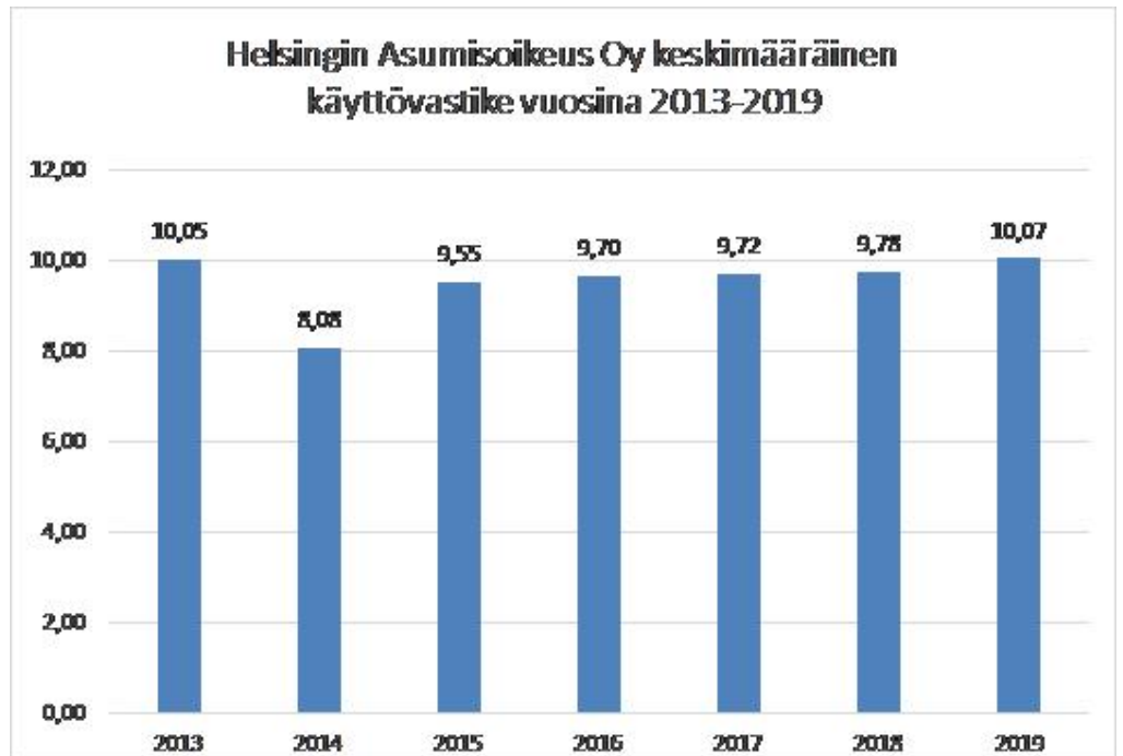
Kuva. Hason keskivastikkeen kehitys vuosina 2013-2019.