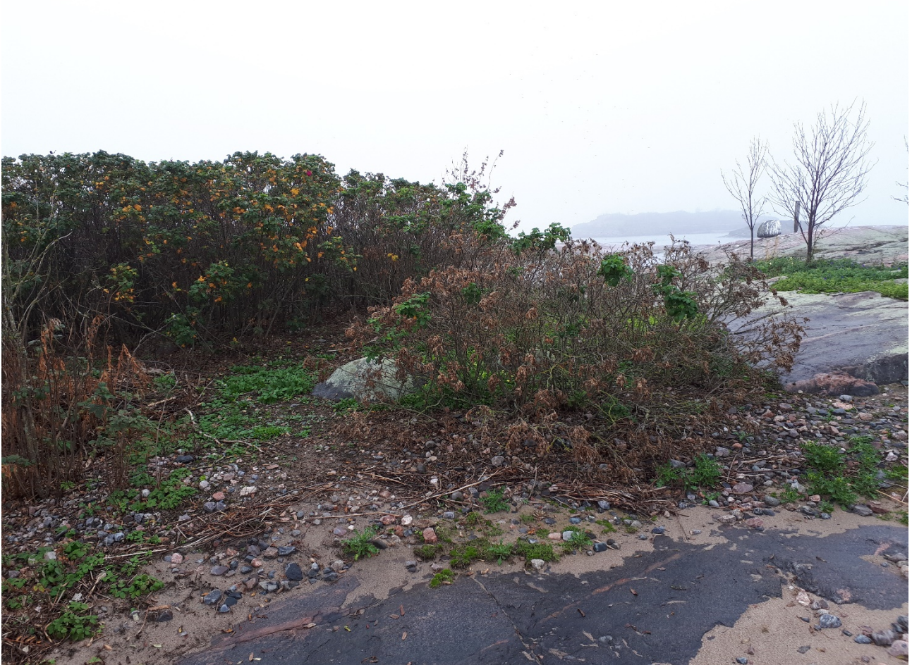
Kuva 1. Kurtturuusupensaikkaa itäisemmällä isolla luodolla.

Kullekin luodolle sijoitetaan suojelupäätöksen jälkeen punakeltainen maihinnousun ja ympäröivällä vesialueella 25 metrin säteellä luodosta liikkumisen 1.4.-15.8. kieltävä taulu. Muina aikoina liikkumista ja rantautumista ei ole rajoitettu, ja luotoa voidaan käyttää rauhoitusmääräysten sallimaan virkistykseen, kuten kalastukseen.