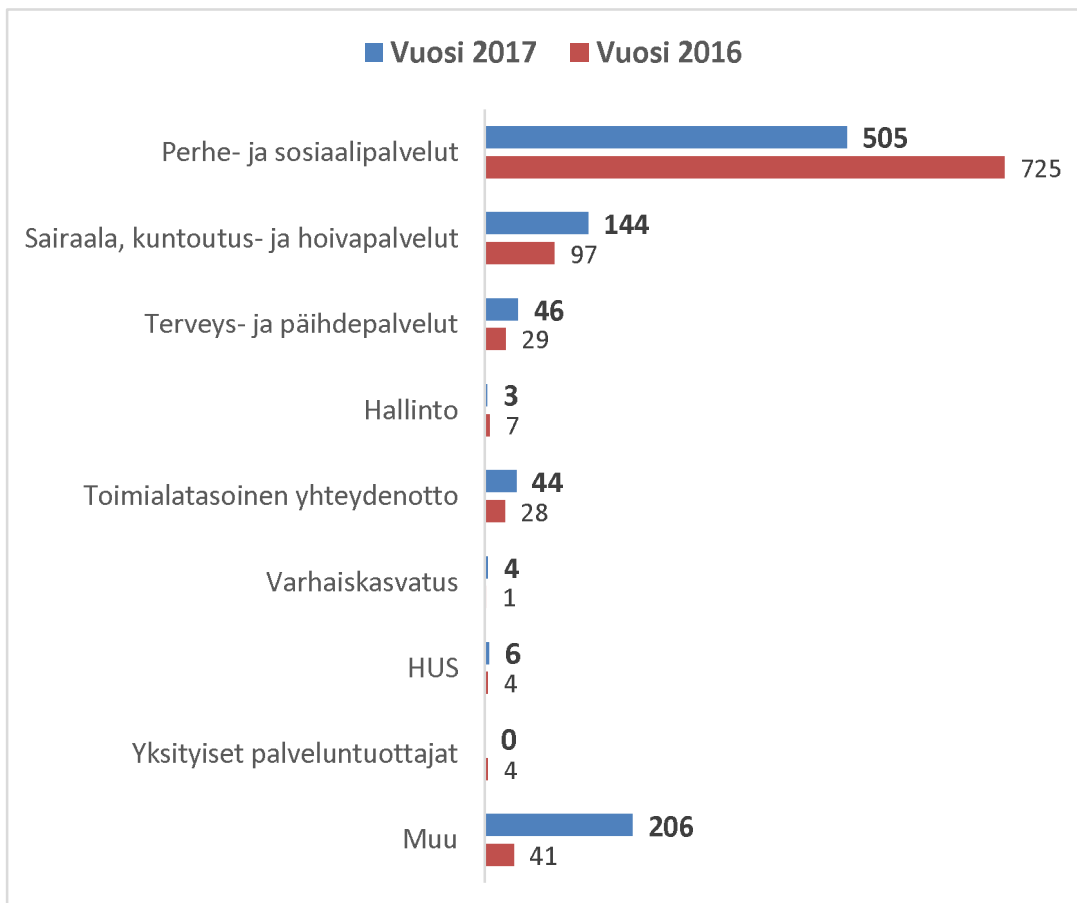
Kuvio 2. Yhteydenotot sosiaaliasiamiehiin palvelutahon mukaan vuosina 2016-2017

Kuviosta 2 ilmenee yhteydenotot sosiaaliasiamiehiin palvelutahon mukaan. Yhteydenotot perhe- ja sosiaalipalveluista vähenivät merkittävästi edellisvuoteen nähden, kun taas muuta palvelutahoa koskevien asioiden määrä kasvoi merkittävästi. Kansaneläkelaitos oli ylivoimaisesti suurin muu taho, jonka palvelusta ja etuuksista asiakkaat olivat yhteydessä sosiaaliasiamiehiin. Myös sairaala- kuntoutus- ja hoivapalveluja koskevien yhteydenottojen määrä kasvoi vuoteen 2017 verrattuna.