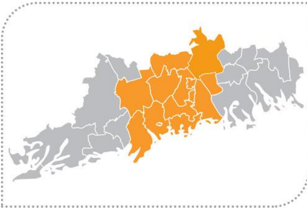
Helsingin seudun vaihekaava