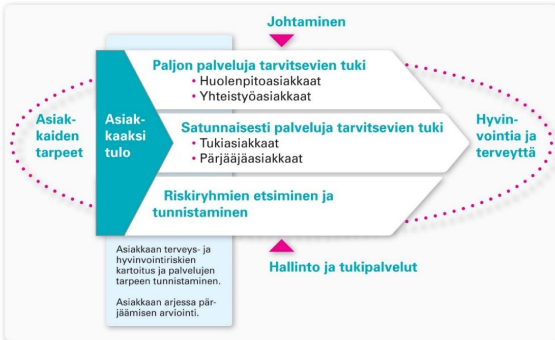
Kuvio 1. Sosiaali- ja terveysviraston prosessikartta

Ydinprosessien kehittäminen on aloitettu vuonna 2015 asiakkaaksi tulon prosessista. Asiakkaaksi tulo on monikanavainen, koordinoitu kokonaisuus, jonka jokainen vaihe tuottaa asiakkaalle lisäarvoa. Tavoitteena on kehittää asiakkaaksi tulon prosessia mahdollisimman tehokkaasti sähköisiä palveluratkaisuja hyödyntäväksi, jolloin resursseja voidaan vapauttaa palvelujen saatavuuden parantamiseen, monimutkaisten asiakastarpeiden tehokkaampaan ratkaisemiseen ja tunnistamattoman palvelutarpeen asiakkaiden etsimiseen ja tunnistamiseen. Tavoitteena on, että asiakas arvioidaan vain kerran, tarpeen mukaan moniammatillisesti lähtökohtana yksi yhteinen hoito- ja palvelusuunnitelma.