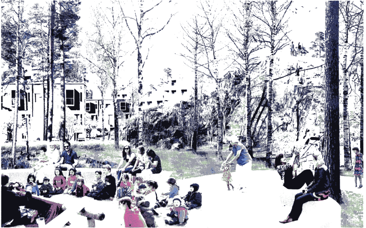
Kuva 3. Meri-Rastilan Pohjavedenpuiston havainnekuva.