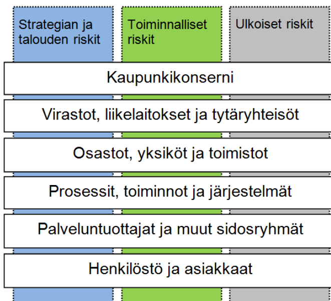
Kuva 2. Riskienhallinnan näkökulmat ja ulottuvuudet

Seuraavassa esitetyt näkökulmat on huomioitava sisäisen valvonnan ja riskienhallinnan järjestämisessä ja toteuttamisessa, päätöksenteossa sekä raportoinnissa.