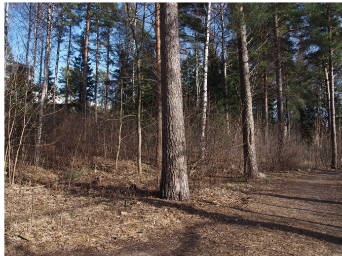
13.3.2014 esiintymän luoteisosasta itään: mäntyvaltainen rinnemetsä