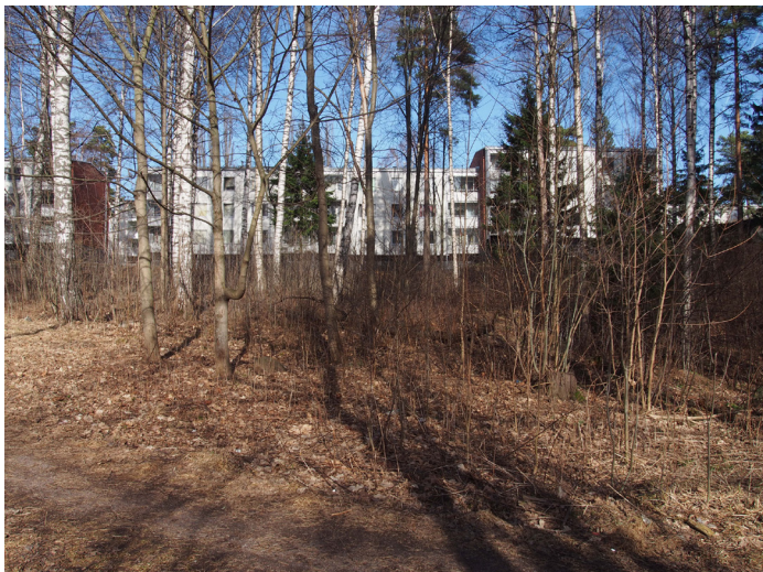
13.3.2014 esiintymän luoteisosan rinnemetsää