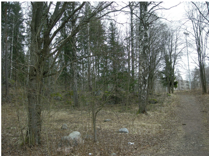
22.4.2010 esiintymän keskivaiheilta: polku puistokäytävältä koilliseen kentän suuntaan