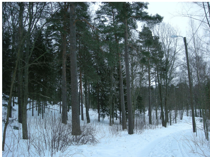
8.3.2010 esiintymän luoteisosasta itään: rinnemetsä ja puistokäytävä