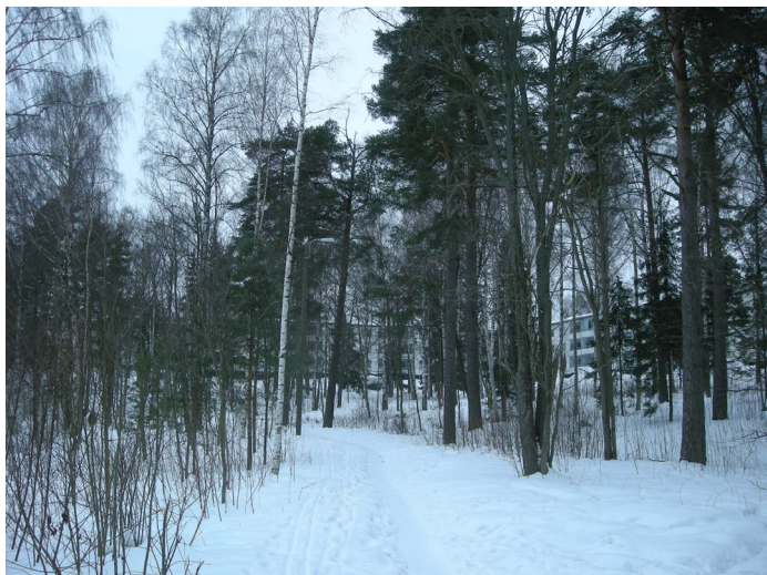
8.3.2010 esiintymän keskivaiheilta: puistokäytävä ja rinnemetsä luoteeseen

Vaarnatien asemakaava-alueen valituksenalainen vaahteraesiintymä, luoteisosa