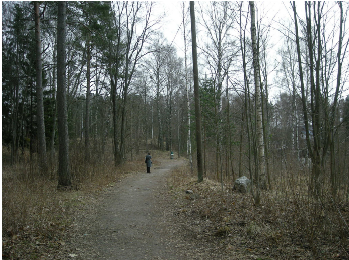
22.4.2010 esiintymän luoteisosasta itään: puistokäytävä